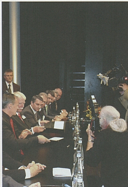
Grosses Medieninteresse am letzten grossen Werkvertrag.

In den kommenden Monaten erstellt die Arbeitsgemeinschaft Transtec Gotthard das Ausführungsprojekt. Nach der Bewilligung durch das Bundesamt für Verkehr (BAV) werden auf dem Bahntechnik-Installationsplatz in Biasca die Arbeiten aufgenommen. Mit dem Einbau der Bahntechnik über das Südportal wird in der zweiten Jahreshälfte 2009 begonnen, in Erstfeld über das Nordportal Ende 2012.