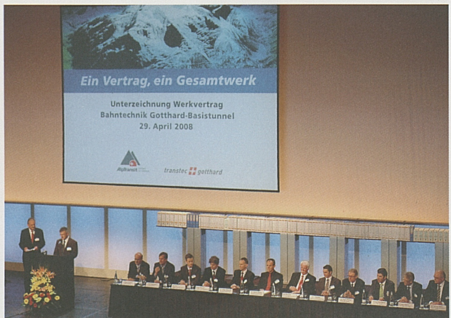
Der Werkvertrag für das letzte grosse Baulos am Gotthard gelangt im Luzerner KKL zur Unterzeichnung.