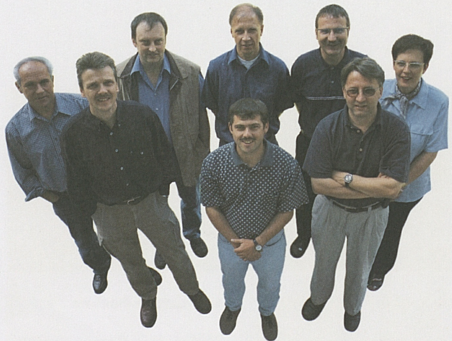
Die Mitglieder der Neat-Begleitkommission der Gemeinde Silenen.

Mit dem Beginn der Arbeiten wird nun geprüft, was bisher auf dem Papier entstanden ist. Es gilt, die ausgehandelten Massnahmen umzusetzen und gemeinsam einer guten Lösung zuzuführen.