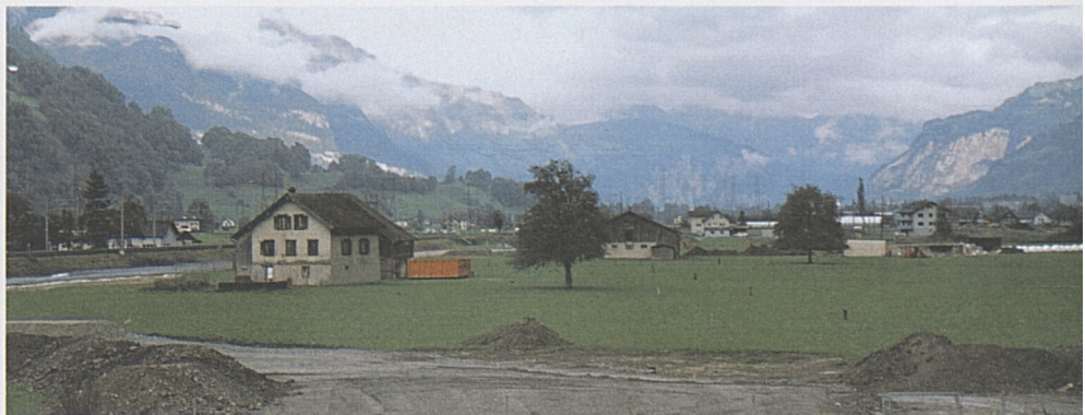
Das Besucherzentrum Erstfeld wird nördlich des A2-Autobahnzubringers erstellt.

Nördlich vom A2-Autobahnzubringer erstellt die AlpTransit Gotthard AG für die Zeit bis zur Inbetriebnahme des Gotthard-Basistunnels ein attraktives Informations- und Besucherzentrum. Auf einer Fläche von rund 400 m² werden sich der Kanton Uri und die ATG präsentieren. Die Ausstellung wird dem Bau des längsten Eisenbahntunnels der Welt gewidmet sein und zeigt Themen des Tunnelbaus. Der Kanton Uri hat Gelegenheit, sich innerhalb dieser Ausstellung mit einem attraktiven Auftritt zu profilieren. Ergänzend dazu können die Besucher/-innen über eine Passerelle und einen Baustellenweg die NEAT-Grossbaustelle Erstfeld zu Fuss erkunden oder in geführten Gruppen einen Informationsrundgang unter Tag absolvieren. Das Besucherzentrum in Erstfeld wird von der AlpTransit Gotthard AG erstellt und betrieben. Der Beginn der Bauarbeiten für das Besucherzentrum ist Ende 2005, die Eröffnung Mitte 2006 vorgesehen.