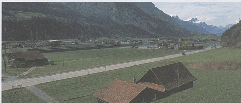
Der Baubeginn im Raum Erstfeld ist für die Eröffnung der neuen Gotthardbahn von zentraler Bedeutung.

Im März 2004 erteilte das Eidgenössische Departement für Umwelt, Verkehr, Energie und Kommunikation (UVEK) der AlpTransit Gotthard AG die Baubewilligung für den Abschnitt Erstfeld des Gotthard-Basistunnels. Die ATG hat in der Zwischenzeit die von Bundesrat Moritz Leuenberger unterzeichnete Plangenehmigungsverfügung für das NEAT-Auflageprojekt Uri 2003 analysiert und weitere Schritte in die Wege geleitet. Als Folge der Verfügung sind verschiedene Projektänderungen notwendig. Unter anderem: eine vierspurige Überholgleisanlage, die Verlegung der Materialzwischenlager Erstfeld vom Rynächt in den Bereich Chalchofen, zusätzliche Materialzwischenlager und ein kombinierter Rad- und Gehweg entlang des Walenbrunnens. Wenn alles rund läuft, werden im Sommer 2004 im Raum Erstfeld die Arbeiten aufgenommen.