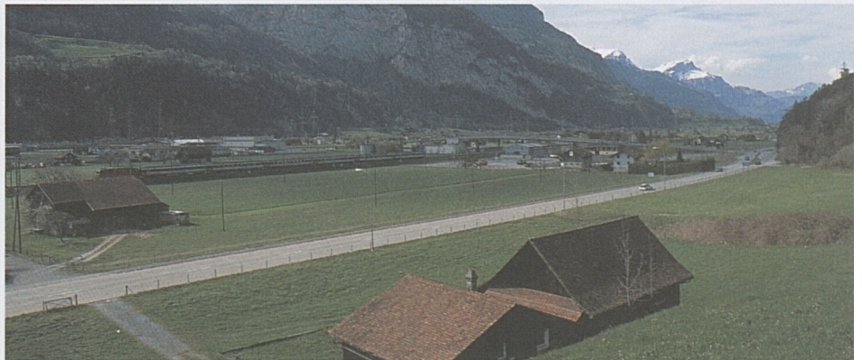
Der Baubeginn im Raum Erstfeld ist für die Eröffnung der neuen Gotthardbahn von zentraler Bedeutung.

Im März 2004 erteilte das Eidgenössische Departement für Umwelt, Verkehr, Energie und Kommunikation (UVEK) der AlpTransit Gotthard AG die Baubewilligung für den Abschnitt Erstfeld des Gotthard-Basistunnels. Die ATG hat in der Zwischenzeit die von Bundesrat Moritz Leuenberger unterzeichnete Plangenehmigungsverfügung für das NEAT-Auflageprojekt Uri 2003 analysiert und weitere Schritte in die Wege geleitet. Als Folge der Verfügung sind verschiedene Projektänderungen notwendig. Unter anderem: eine vierspurige Überholgleisanlage, die Verlegung der Materialzwischenlager Erstfeld vom Rynächt in den Bereich Chalchoven, zusätzliche Materialzwischenlager und ein kombinierter Rad- und Gehweg entlang des Walenbrunnens. Wenn alles rund läuft, werden im Sommer 2004 im Raum Erstfeld die Arbeiten aufgenommen.