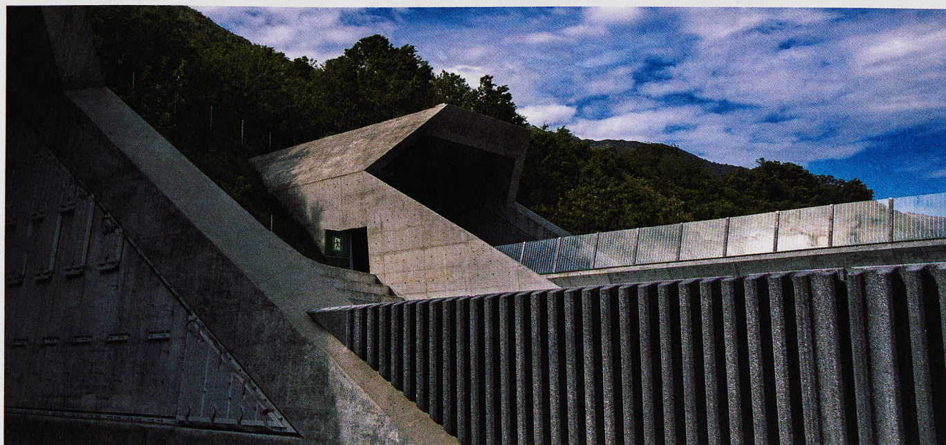
Galleria di base del Ceneri. In alto: è iniziato lo smontaggio delle installazioni provvisorie. In centro: la posa della catenaria rigida è terminata e i ventilatori sono stati installati. In basso: portale nord a Vigana.