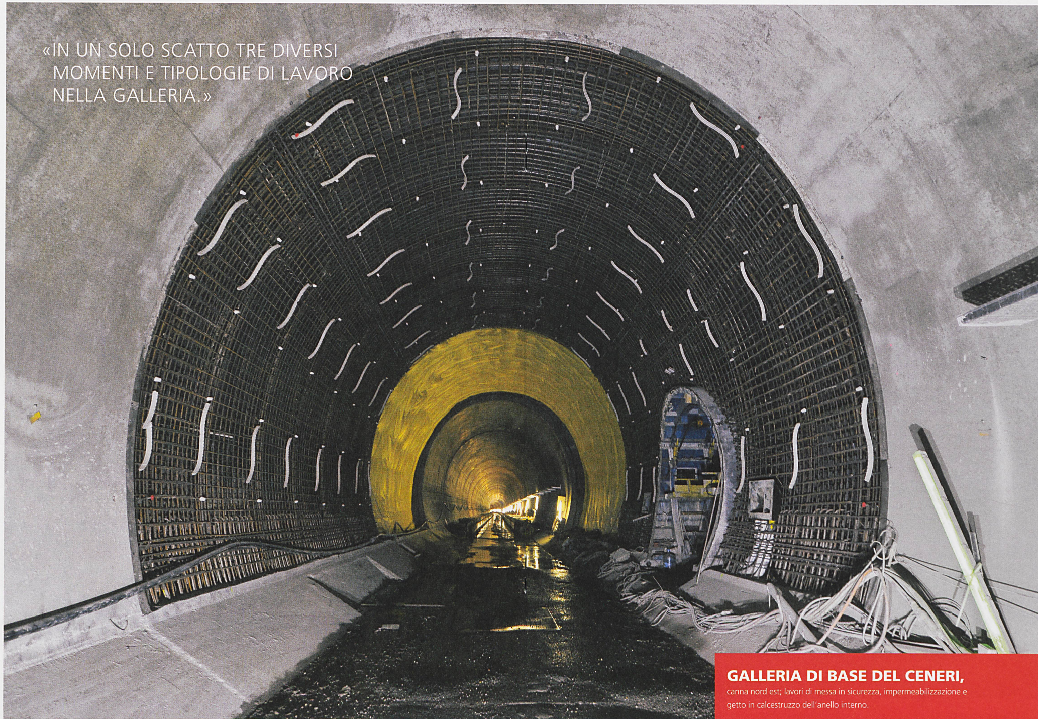
GALLERIA DI BASE DEL CENERI, canna nord est; lavori di messa in sicurezza, impermeabilizzazione e getto in calcestruzzo dell'anello interno.

«IN UN SOLO SCATTO TRE DIVERSI MOMENTI E TIPOLOGIE DI LAVORO NELLA GALLERIA.»