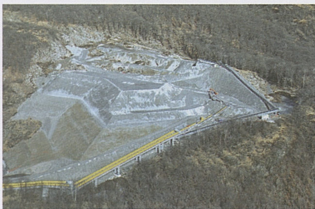
Sigirino: deposito definitivo del materiale.