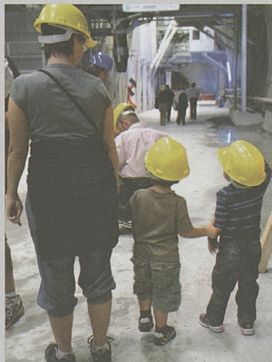
Giornata delle porte aperte: un appuntamento per grandi e piccini.

Come da tradizione, anche quest'anno AlpTransit San Gotardo SA aprirà i cancelli dei suoi cantieri a tutte le persone che vogliono avvicinarsi a questo grande progetto. La giornata delle porte aperte è prevista per sabato 10 settembre 2011 nei cantieri del Nodo di Camorino e del Ceneri (portale nord). Per grandi e piccini ci sarà dunque la possibilità di accedere dal portale nord alla Galleria di base del Ceneri, di scoprire il funzionamento dell'impianto di depurazione delle acque oppure di approfondire gli aspetti ambientali con l'accompagnatore ambientale.