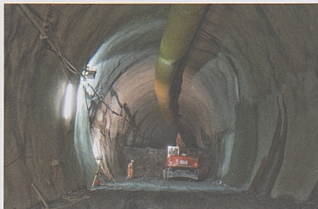
Vezia: avanzamento dello strozzo.

Il controavanzamento di entrambi i tubi ha superato i 300 m. Sul cantiere esterno, procedono i lavori per la realizzazione del rilevato della bretella di uscita dal cantiere (innesto autostradale), così come i lavori di costruzione dei muri di sostegno a monte della linea ferroviaria.