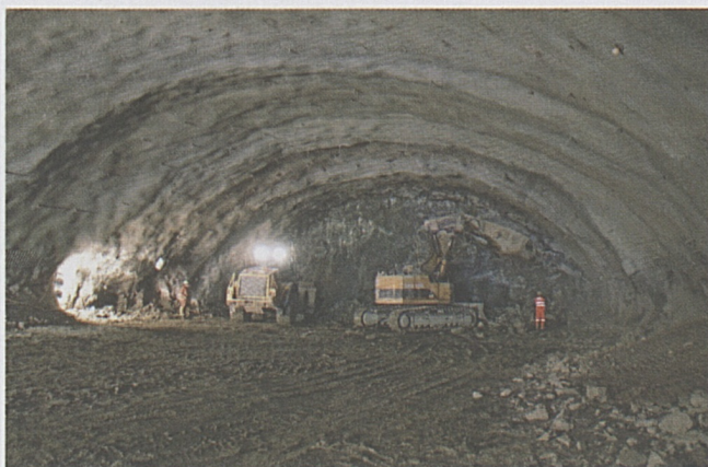
Vigana: avanzamento in calotta.