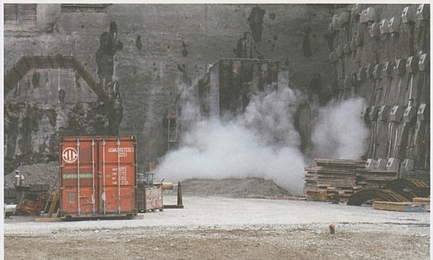
Il 12 aprile è iniziato il controavanzamento anche dal portale sud di Vezia.

dere in sotterraneo e rendersi conto personalmente dell'imponenza dell'opera che stiamo realizzando per garantire la mobilità del futuro nella nostra regione. Segnatevi la data e ...buona estate!