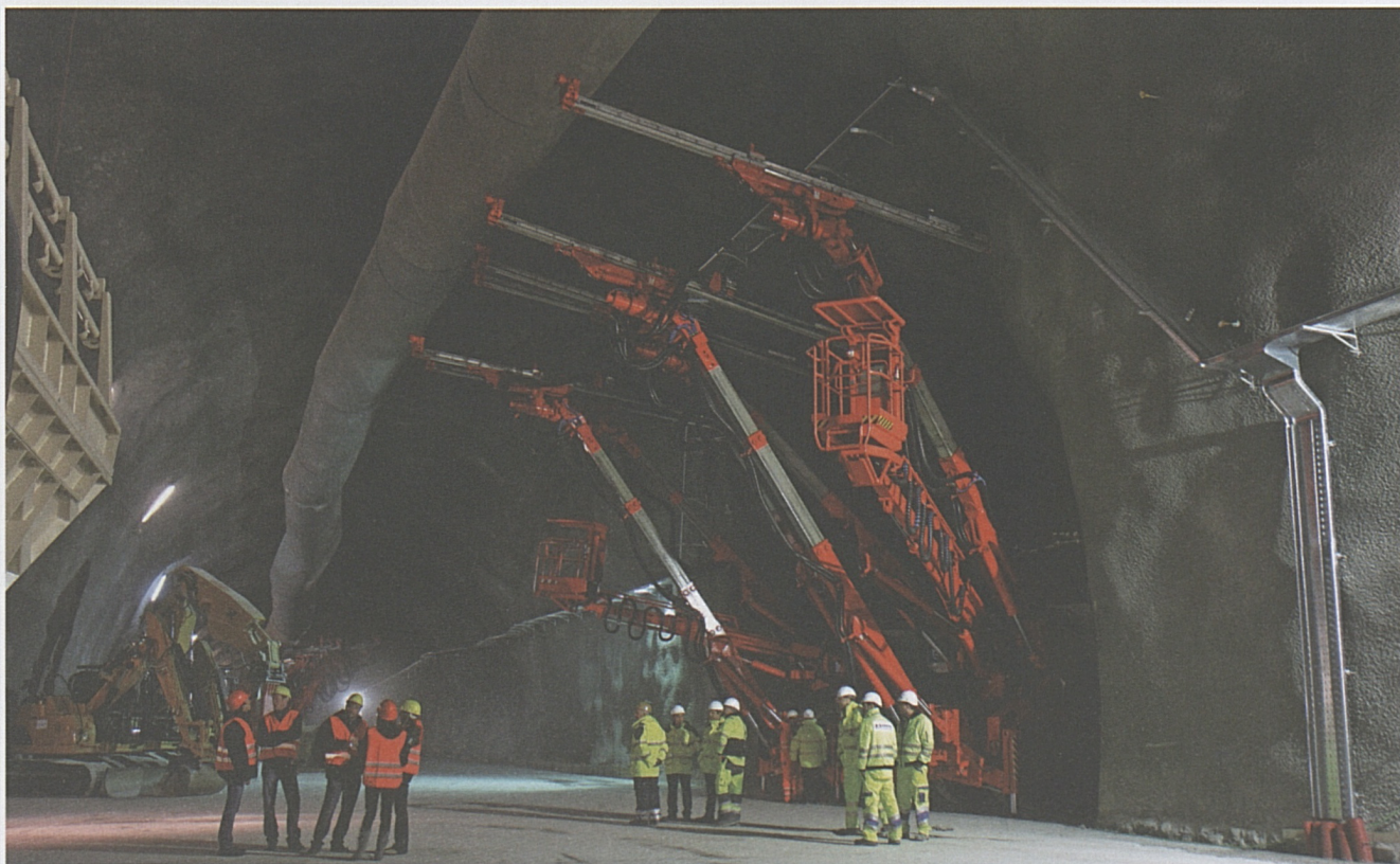
È il 10 marzo 2010: tutto è pronto per il primo brillamento all'interno della caverna operativa di Sigirino.

Nel Nodo di Camorino, alcuni lotti principali si stanno alacremente occupando, ad esempio, del sottopasso della strada cantonale e del cavalcavia sopra l'A2 in prossimità dello svincolo autostradale, così come del raddoppio della linea ferroviaria (da 2 a 4 binari) dall'autostrada A2 fino alla stazione di Giubiasco.