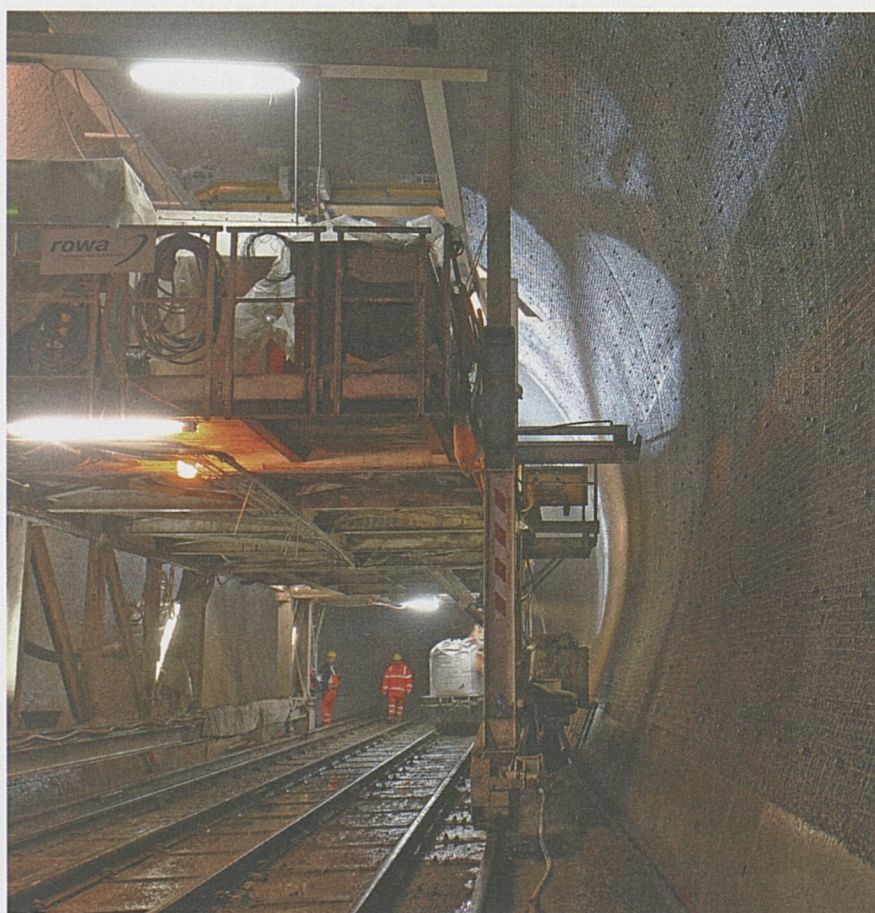
Posa dello strato di protezione antincendio.

A Bodio proseguono i lavori di rivestimento antincendio e del getto delle banchine laterali in calcestruzzo.