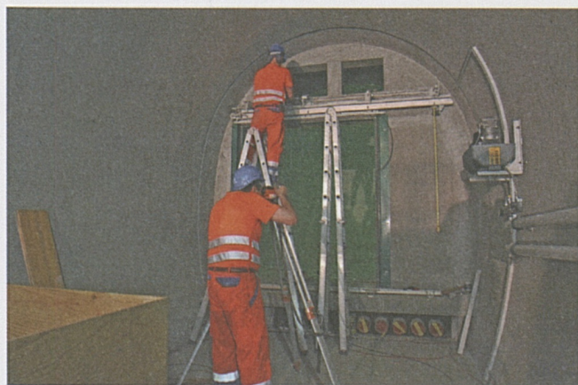
Installazione della porta in un cunicolo trasversale.

Il getto delle banchine laterali in calcestruzzo, per la collocazione di tutti i cavi necessari per l'esercizio, procede secondo programma. Finora sono stati realizzati su ciascun lato 12'000 metri, ovvero il 75% della lunghezza complessiva del sistema di gallerie.