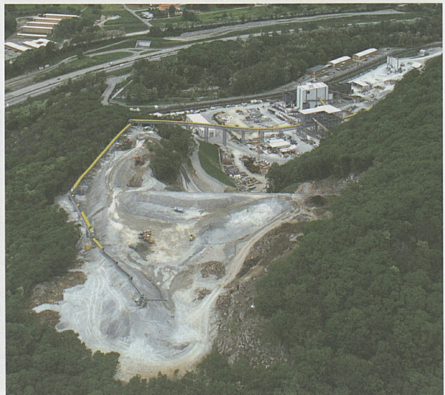
Panoramica sulle installazioni di cantiere "Prati di Regada"