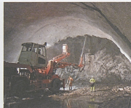
Lavori all'interno della CAOP.

Informazioni e prenotazioni allo 091 873 05 50.