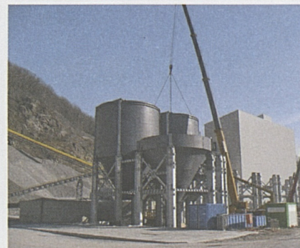
Sili per la raccolta del materiale di scavo.