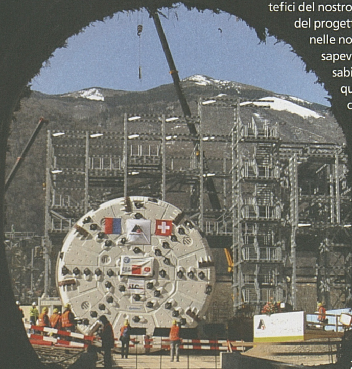
Foto: Avvio della fresa a Sigirino

Messa in esercizio della strada cantonale provvisoria spostata a Camorino