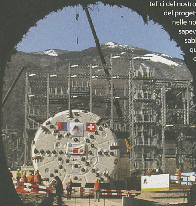
Foto: Avvio della fresa a Sigirino

Messa in esercizio della strada cantonale provvisoria spostata a Camorino