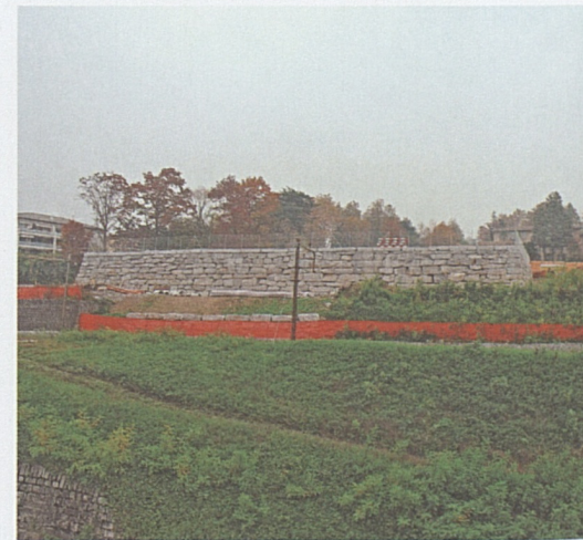
Muro di sostegno del parcheggio CSB.

Panoramica del cantiere ATG (sopra) e del cantiere PTL Vedeggio (sotto).