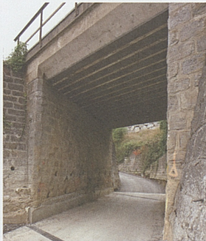
Sottopasso FFS Via alla Cassina.

fonda della trincea, invece, inizierà a partire dal mese di giugno 2009.