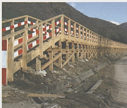
Passerella provvisoria della pista ciclabile. Musicisti del Conservatorio della Svizzera Italiana.