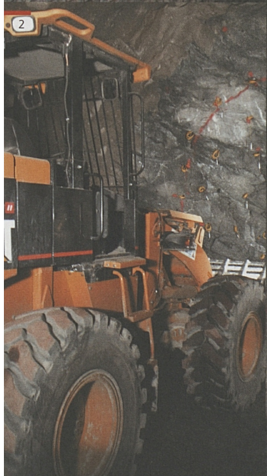
Foto sopra e a destra: Faido, fase di preparazione al brillamento.

Riassumendo: i costi supplementari causati dalla geologia sfavorevole corrispondono, fino ad oggi, unicamente all'1.5% dei costi complessivi della Galleria di base del San Gottardo.