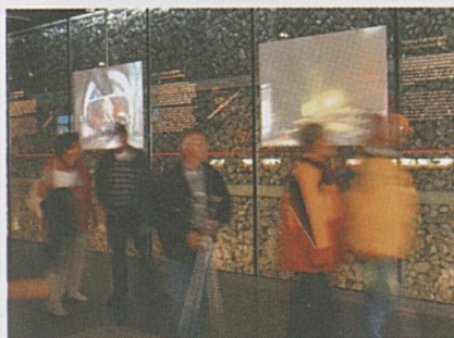
Foto sopra: momenti della cerimonia di accoglienza del 50'000esimo visitatore.