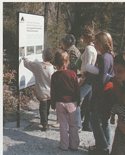
Foto sopra: sul percorso sono sistemate nove tavole didattiche sui principali aspetti del progetto.