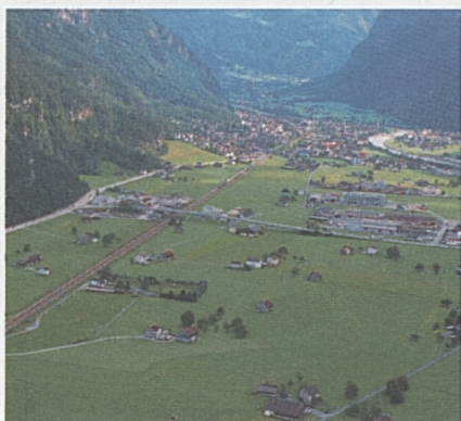
Foto sopra: panoramica della zona che sarà interessata dai lavori del comparto di Erstfeld.