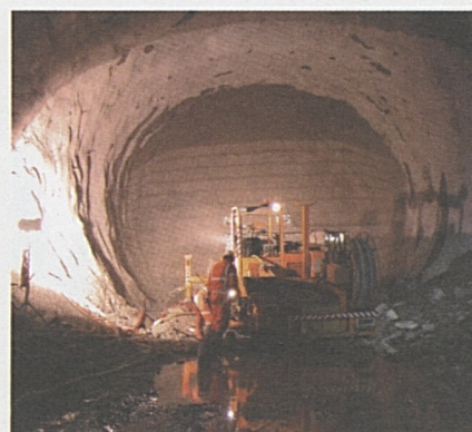
Foto sopra: lavori di scavo nella stazione multifunzionale di Sedrun.