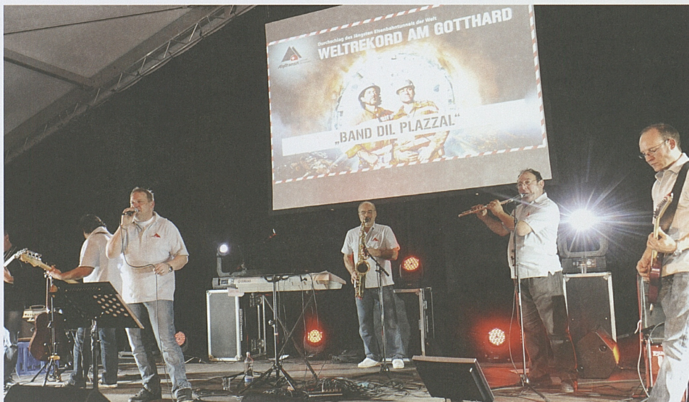
Die Baustellenband sorgt für Stimmung.