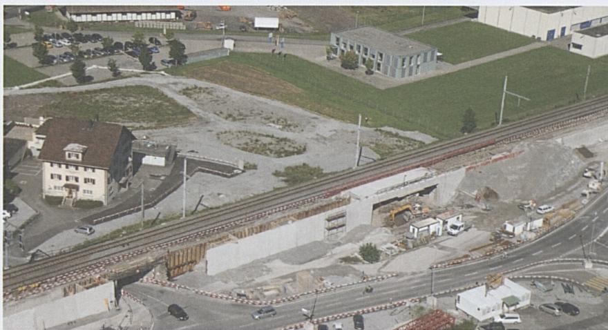
Altdorf/Rynächt: Stützmauern und Vorbereitungsarbeiten für die Unterführung Wysshus (links).

Im Abschnitt zwischen der Unterführung Wysshus und dem Schächenbach sind die Stützmauern mit Ausnahme des Bereichs Unterführung Walter Fürst fertiggestellt. Die Brückenplatten der Unterführung Wysshus (Ost) und der Bahnbrücke Gleis 100 über den Schächenbach wurden abgedichtet. Im Bereich des zukünftigen Gleises für den Einspurbetrieb ab Dezember 2011 werden die Entwässerungen im Trasseebereich erstellt. Ab der Schächenbachbrücke nach Süden erfolgte der Bau der Fahrleitungsmastfundamente.