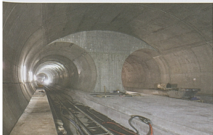
Bodio: Kabeleinzug in der Weströhre.