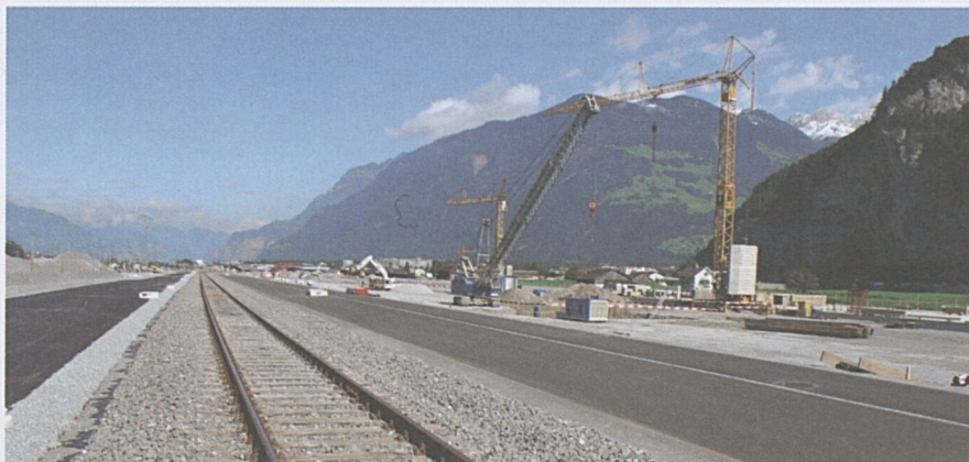
Bahntechnikinstallationsplatz Rynächt: Rohbauarbeiten für die temporären Gebäude.

Im Sommer 2010 übernahm der Bahn-technikunternehmer den Installationsplatz. Jetzt sind Werkleitungen, Kanalisation, Entwässerung sowie die Foundationen für die Betriebsgebäude im Bau.