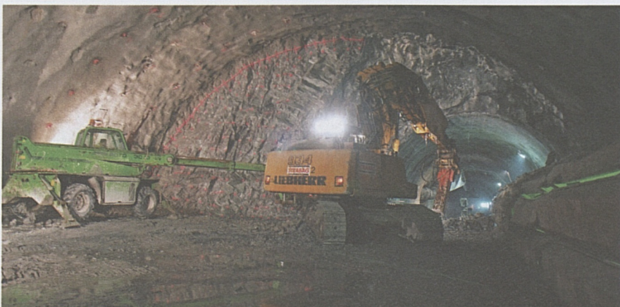
Erstfeld Weströhre Verzweigungsbauwerk: Die letzte Sprengung ist erfolgt und der Ausbruch abgeschlossen.

Im September 2010 erfolgte die letzte Sprengung im nördlichen Teil des Gotthard-Basistunnels. Im Teilabschnitt Erstfeld–Amsteg sprengten die Mineure der Arbeitsgemeinschaft Gotthard-Basistunnel Nord die letzten Meter Fels im Verzweigungsbauwerk «Uri Berg lang». Damit sind die Ausbruch- und Vortriebsarbeiten im Kanton Uri nach 11 Jahren beendet. Die Oströhre des Tagbautunnels steht 50 Meter vor dem bergmännischen Portal. Der Tagbautunnel West steht bei 370 Meter. In beiden Röhren werden zudem die Bankette betoniert. Der Innenausbau in der Oströhre kommt plan-