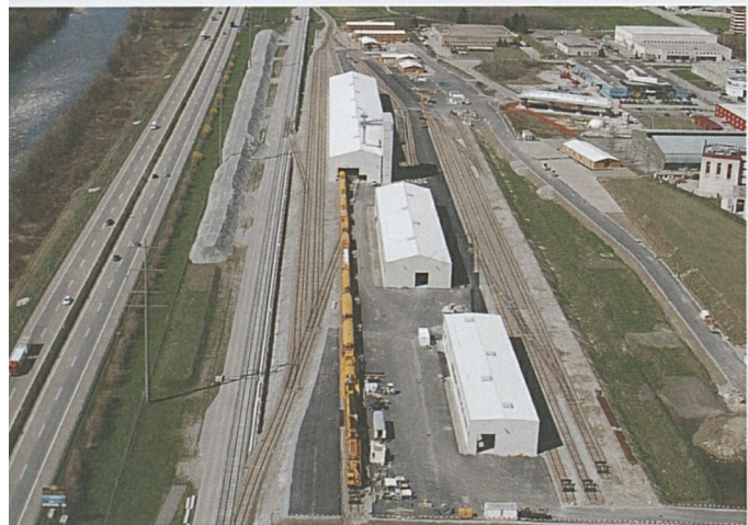
Bahntechnikinstallationsplatz in Biasca mit dem gelben Betonzug.