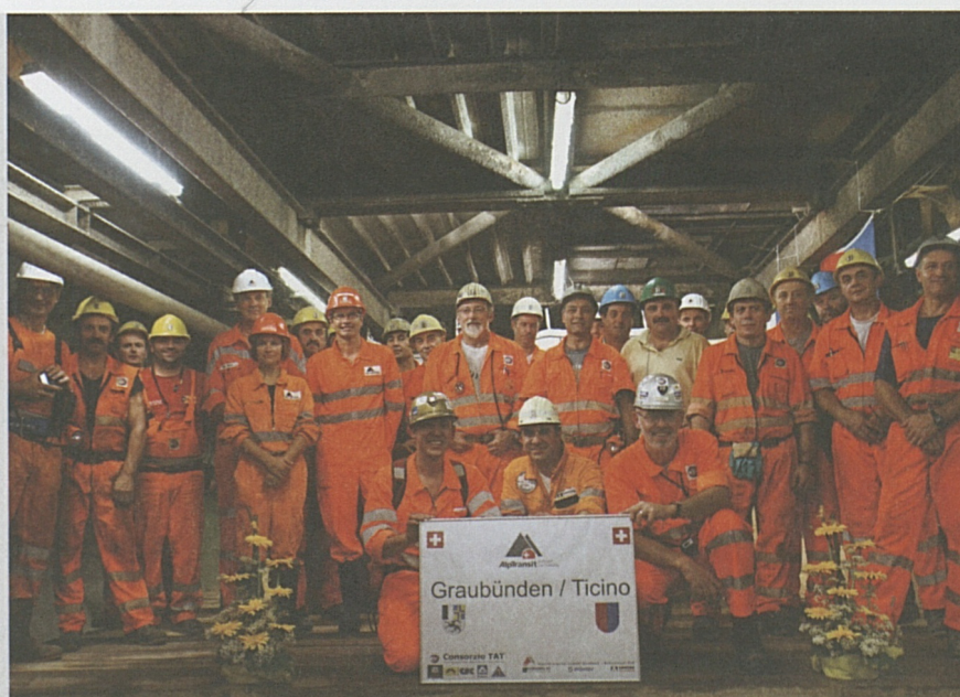
Zufriedene Vortriebscrew auf der Tunnelbohrmaschine: Die Kantonsgrenze Graubünden-Tessin ist erreicht.