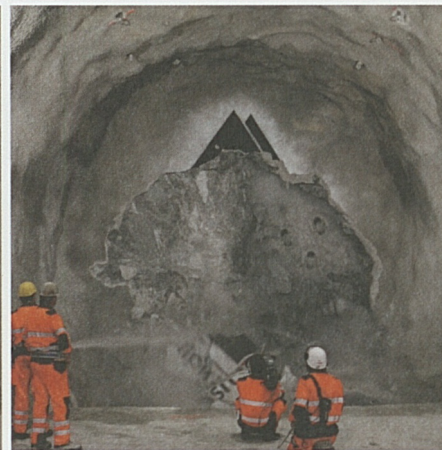
3, 2, 1...: der Countdown bis zum Durchbruch in vier Bildern.