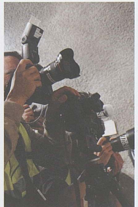
Medienvertreter aus ganz Europa waren vor Ort.