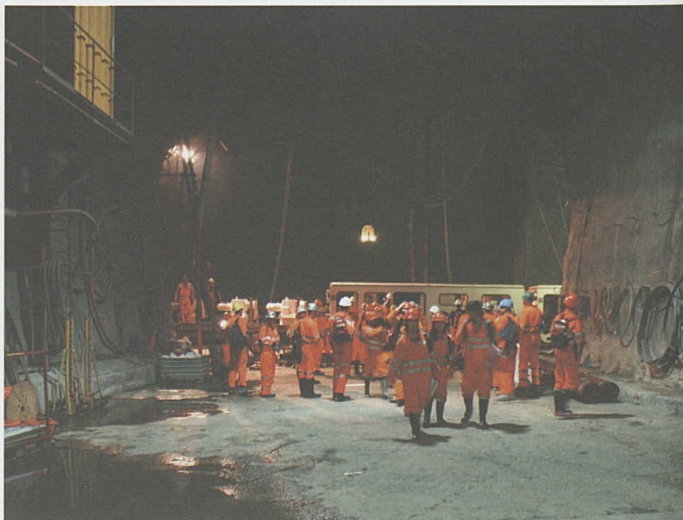
Endstation, alle aussteigen: Journalisten lassen sich vor Ort über die Durchquerung der Piora-Mulde informieren.

Am 15. Oktober 2008 fuhr die TBM die letzten Meter der Piora-Mulde auf. Mit einer Tagesleistung von 10 m kam sie in der rund 150 m langen Piora-Mulde gut voran. Das Gebirge verhielt sich stabil und im Dolomit-reichen Gestein wurden weder nennenswerte Deformationen festgestellt noch Wasser angetroffen. Die Tunnelbohrmaschine der Weströhre wird voraussichtlich im ersten Quartal 2009 auf die Piora-Mulde treffen.