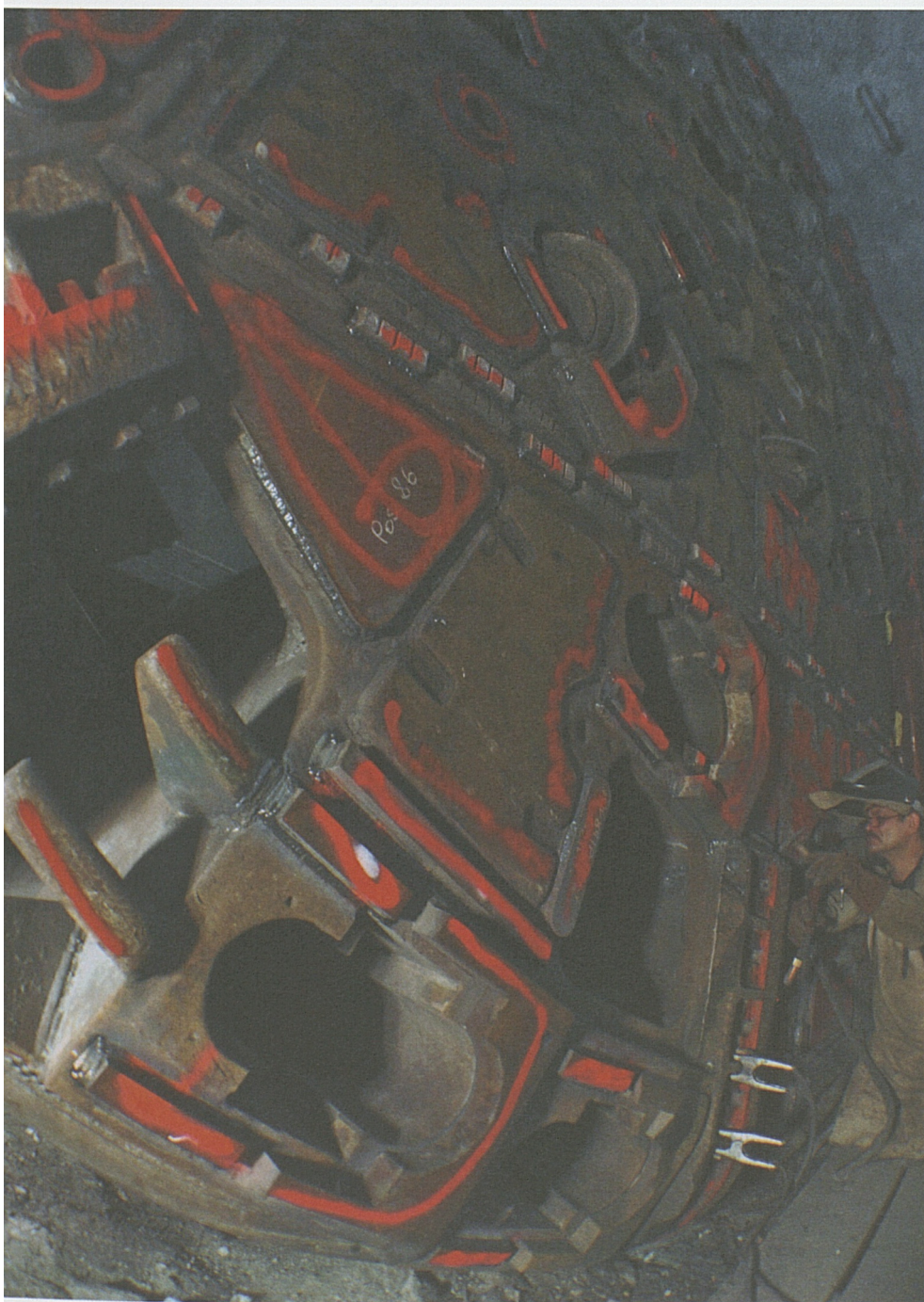
Letzte Vorbereitungen für eine schwierige Reise: Der Bohrkopf wird vor der Piora-Mulde sorgfältig revidiert.