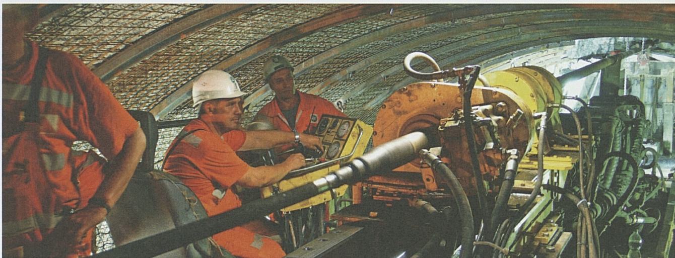
Letzte Sondierbohrung von der Tunnelbohrmaschine aus: Die Piora-Mulde enthält auf Tunnelniveau stabiles und trockenes Gestein.