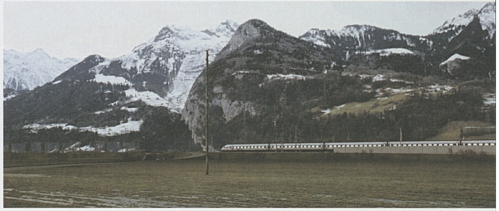
Im Auflageprojekt 2003 wurde die Dammhöhe von 6 auf 3 Meter reduziert – Fotomontage Raum Riedstrasse.