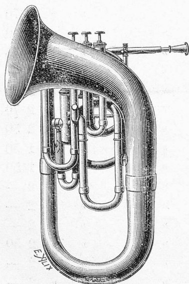
Cor CORNOPHONE Tuba

Tout instrument ne portant pas la marque PROTOTYPE n'est pas un BESSON .