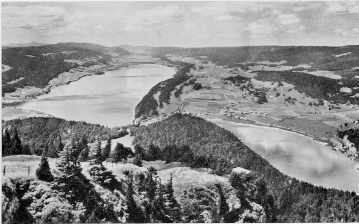
Vallée de Joux. Les Lacs de Joux (en arrière) et Brenet vue du Sommet de la Dent de Vaulion.

Devant nous, le lac de Joux, profond de 32 m, occupe le synclinal principal; en amont du lac, la plaine alluviale où sinue l'Orbe. La rive occidentale du lac de Joux est formée par un anticlinal étroit qui sépare le synclinal de Joux d'un synclinal occupé en son point le plus bas par le lac Brenet; enfin, fermant l'horizon à l'Ouest, le large dôme anticlinal du Risoud.