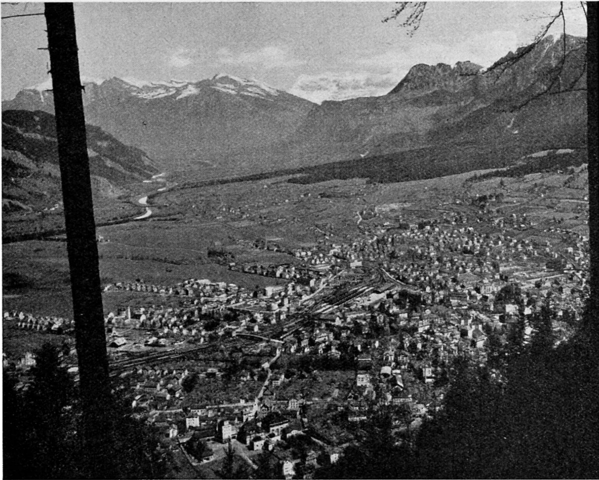
Blick vom Pizokel nach N auf Chur und Rheintal. Penninischer Schiefer der Hochwanggruppe rechts. Davor der Schuttkegel-Piedmont mit dem Fürstenwald. Hintergrund: Scesaplana rechts, Vilan in der Mitte, Falknis links. Mittelgrund links: Calandafuß. Die Altstadt liegt rechts in der Nische.

Felsband, das sich bis zum Kunkelspaß fortsetzt, haben wir die Abrißränder der Felsstürze zu suchen, die zur Bildung der Felsberger und Emser Toma geführt haben. Sie werden, nach W. STAUB und nach J. OBERHOLZER, in der Reihe der Bergstürze des Vorderrheintales die ersten gewesen sein und sind deshalb so weitgehend aufgelöst, auf die wenigen Kleinformen reduziert.