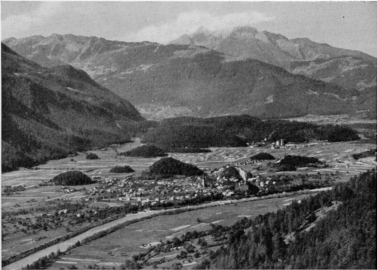
Domat (Ems) vom Calanda gesehen. Blick über die Toma, Bergsturzmassen Ils Aults und Schotterplatte auf die penninische Region der Signinagruppe (Piz Riein und Piz Fess), Heinzenbergausläufer mit alten Verebnungen in zirka 1500 bis 1800 m, Eingang ins Domleschg und Fuß der Dreibündensteingruppe.

N über die für Graubünden ungewohnt breite Fläche der Stauschotter, eine Mittelland-Landschaft im alpinen Rahmen. Zwei relativ breite, flache Talungen durchziehen die Ebene, die eine vom Schloß nach N gegen Ruver, die andere, eindrucksvollere, am Nordrand von Bonaduz in W-E-Richtung. Es sind wohl Schmelzwasserrinnen, die sehr gut dem von R. STAUB begründeten Flimser Stadium zugewiesen werden können. Hinter- und Vorderrhein waren damals auf der Platte kaum eingetieft.