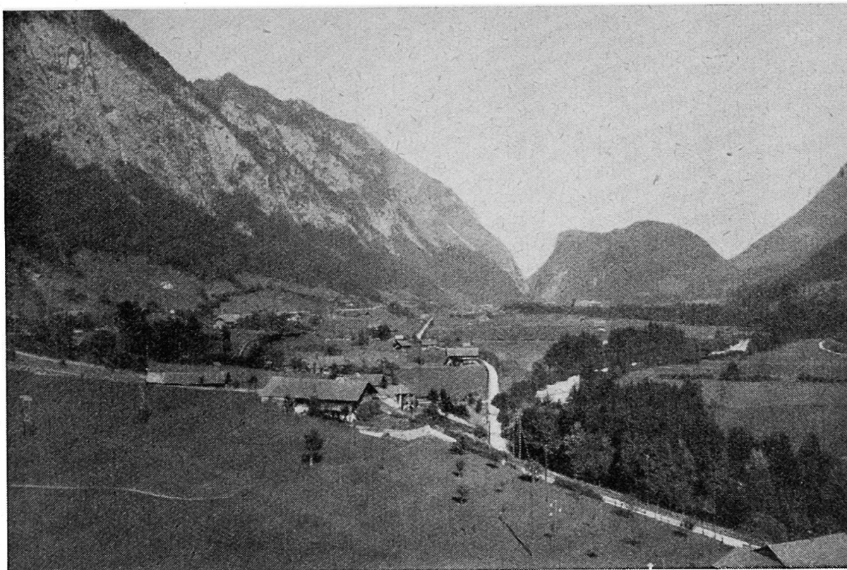
Abb. 2. Der Abschluß des Simmentals aus SW. Simmenfluh—Port—Burgfluh—Niesenfuß

Sie weist folgende Vorkommen auf (Numerierung nach Abb. 4): Ringoldingen (Metschenmatte, 3), Steinischuttkegel bei Erlenbach (4), «im Schlatt» (5), beim «Kastel» (6), Latterbach («auf der Nagelfluh», bis «im Drittel», 9), Station Oey (7), in der Port (11). Dazu finden sich noch die weitem Vorkommen: Ringoldingen (Zelg, 1), Mühleboden (2), Erlenbach (Kleindorf, ohne Nummer), 200 m S Oey (linkes Kirelufer, ohne Nummer), E Oeyfeld (8) und S Burgholz (10). Bei Zelg (1) bestehen die verfestigten Schotter zum Teil aus groben, bis 1 \text{ m}^3 großen Blöcken. Sie verraten uns die damalige Gletschnähe. Die Partie «im Schlatt» (5) wurde bei einer Wegverbreiterung im Winter 1922/23 zum größten Teil, in der Port (11) aus dem gleichen Grunde im Jahre 1939 vollständig weggesprengt.