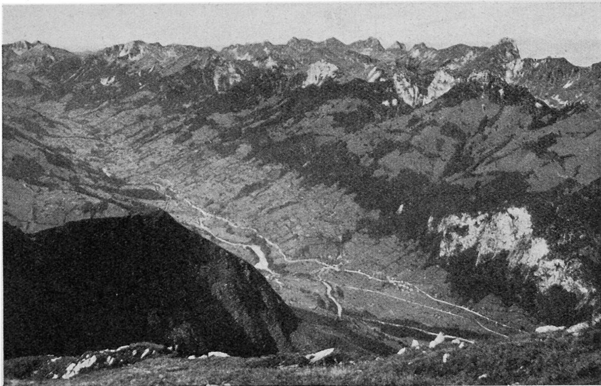
Abb. 1. Das Niedersimmental von Oberwil bis Außerlatterbach. Käufliche Ansichtskarte