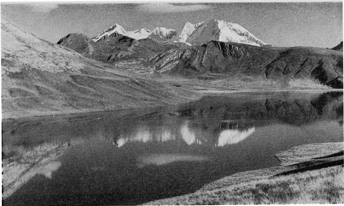
Abb. 2. Glazialsee auf der kontinentalen Wasserscheide der Westkordillere Perus. Im Hintergrund der 5700 m hohe Tunshu. Der See ist bei 4300 m Meereshöhe voller Forellen.