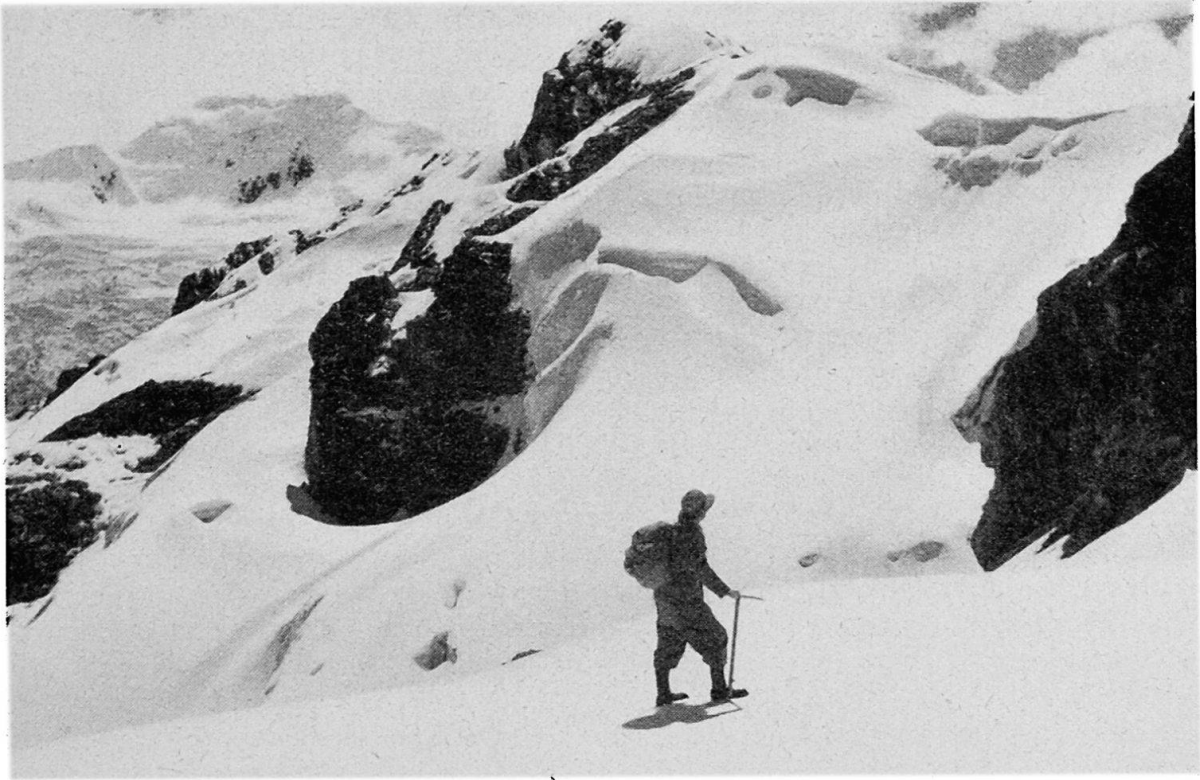
Abbildung 1. Beim Aufstieg in der Ostkordillere. Links der 5700 m hohe eisgepanzerte Lasontay.