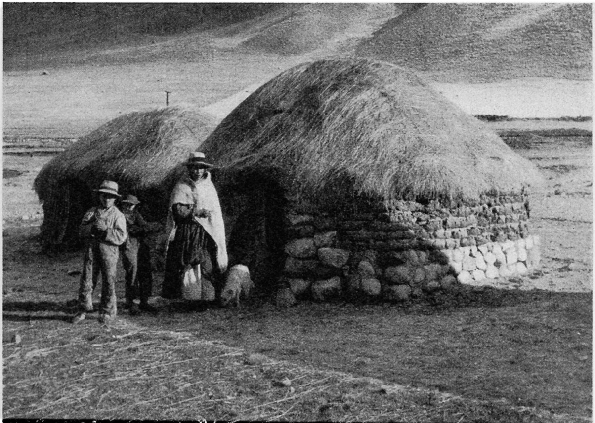
Abbildung 3. Peruanische Sennhütten in einem Weidegebiet Mittelperus.

Es war am Tag, da der zweite Weltkrieg ausbrach, als die ausgezeichneten deutschen Alpinisten Dr. SCHWEIZER und ROHRER mit DIENER aus Zürich den Nordpfeiler der