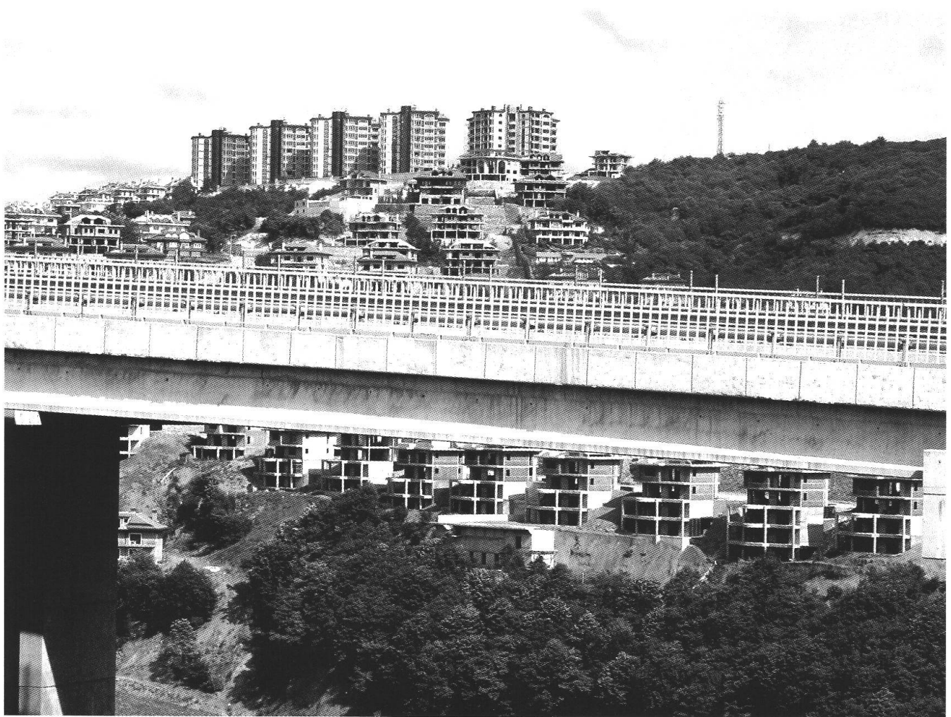
Photo 1: Les cités sécurisées d'Acarkent et de Beykoz Konaklari, avec le viaduc nouvellement construit, en juillet 2002

The gated communities Acarkent and Beykoz Konaklari, with the newly built viaduct, in July 2002