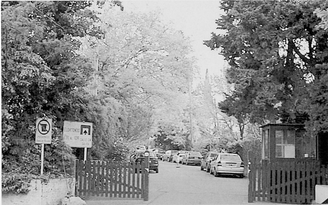
Foto 1: Immer mehr Wohngebiete der Oberschicht werden – oftmals illegal – nachträglich abgesperrt.

More and more neighbourhoods of the upper classes are enclosed – in most cases illegally.