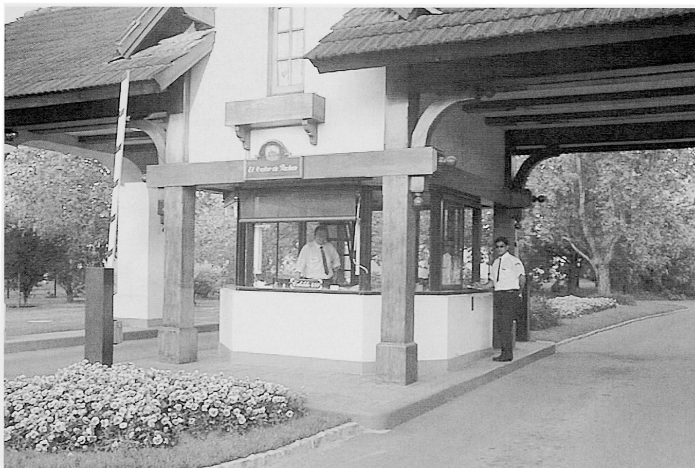
Foto 2: Repräsentative Einfahrten charakterisieren den Status von Country Clubs der oberen Mittelschicht. Representative entrance gates characterize the status of upper middle class Country Clubs. Des entrées représentatives caractérisent le statut du Country Club de la bourgeoisie moyenne.

von Buenos Aires, die durch einen eigenen Autobahn- und Bahnanschluss mit dem Stadtzentrum verbunden wird. Wie in einer gewachsenen Stadt gibt es unterschiedliche Funktions- und Nutzungszonen und unterschiedliche Dichtewerte und Bodenpreise (vgl. JANOSCHKA 2002b).