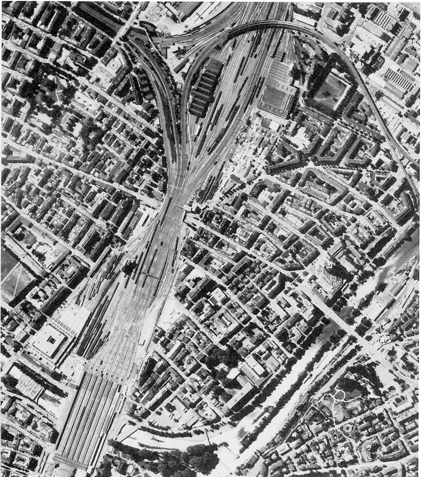
Abb. 1: Zürich: Umgebung der Langstrasse (Kreise 4 und 5)

Zurich: Surroundings of Langstrasse (districts 4 and 5)