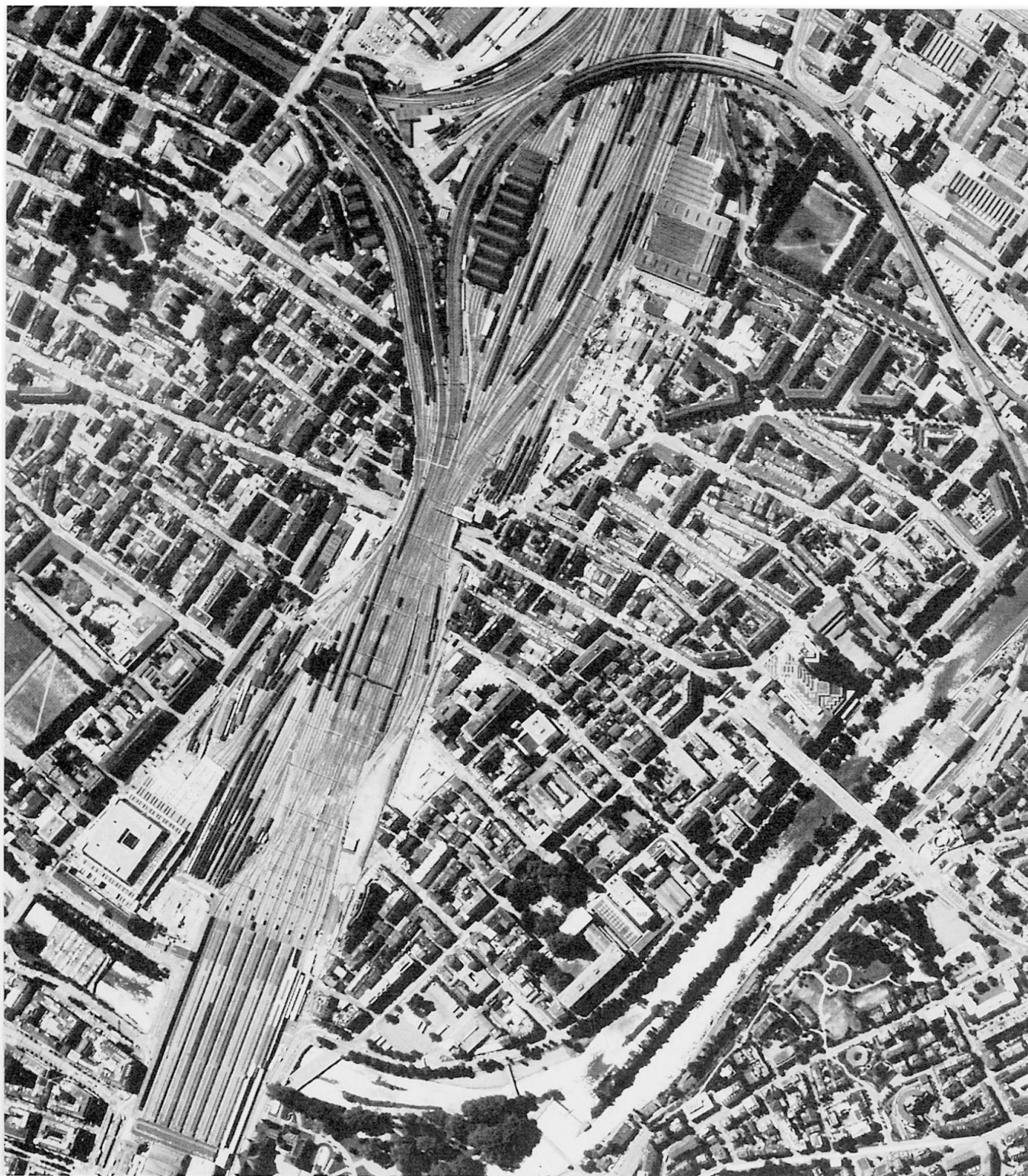
Abb. 1: Zürich: Umgebung der Langstrasse (Kreise 4 und 5)

Zurich: Surroundings of Langstrasse (districts 4 and 5)