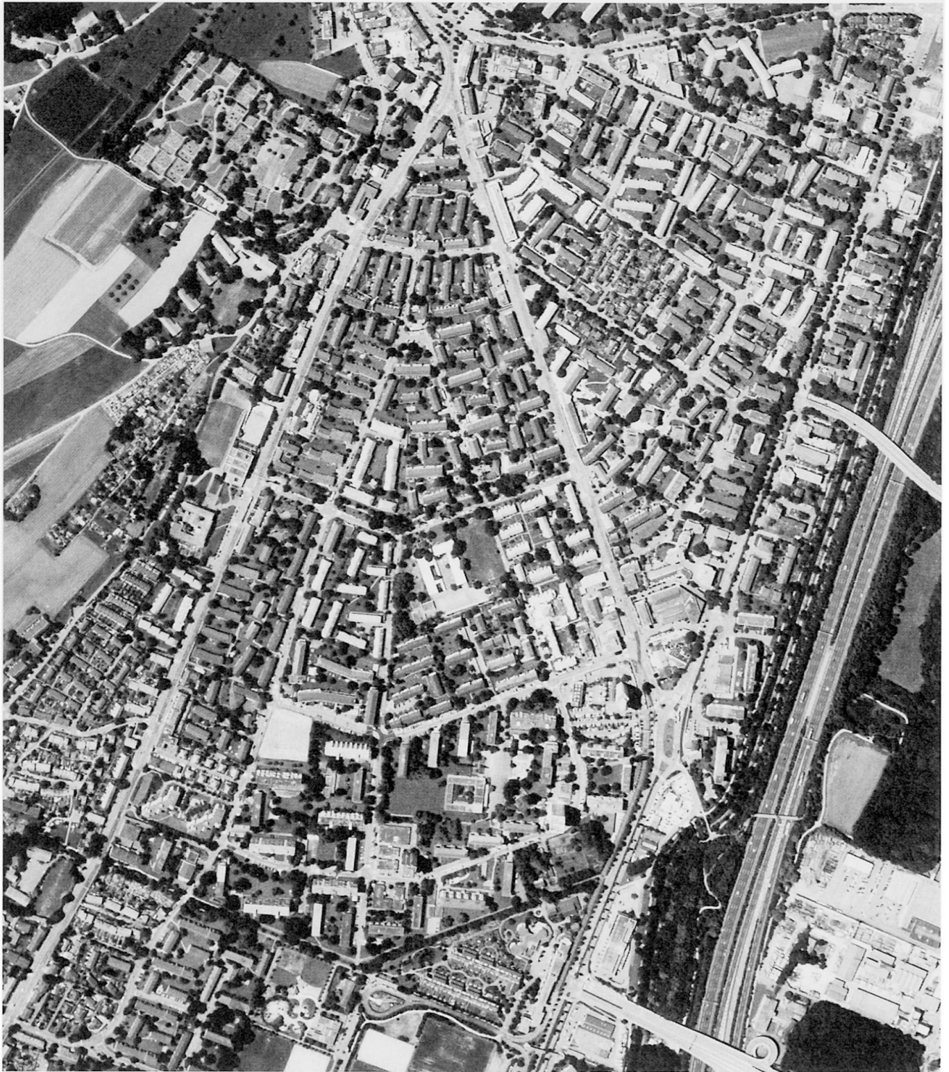
Abb. 2: Zürich: Schwamendingen (Kreis 12).