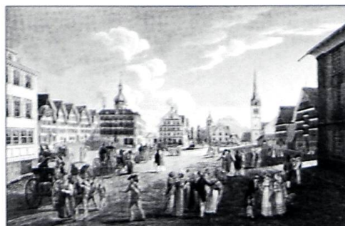
APPENZELL AUSSERRHODEN AUF DRUCKGRAFISCHEN ANSICHTEN