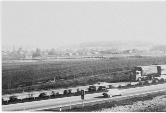
Aufnahme 1

Das Projekt der SBB hätte zwischen heutiger Linie und N1 mit einem Damm von 14 m Höhe die Ebene schräg zerschnitten.