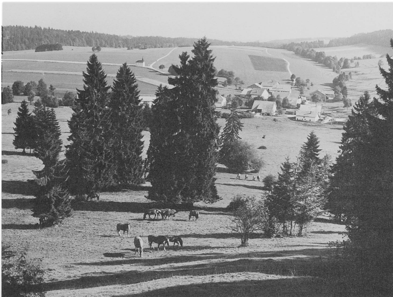
Les Franches-Montagnes (Jura).

Le canton de Neuchâtel par exemple a balisé toute une série d'itinéraires