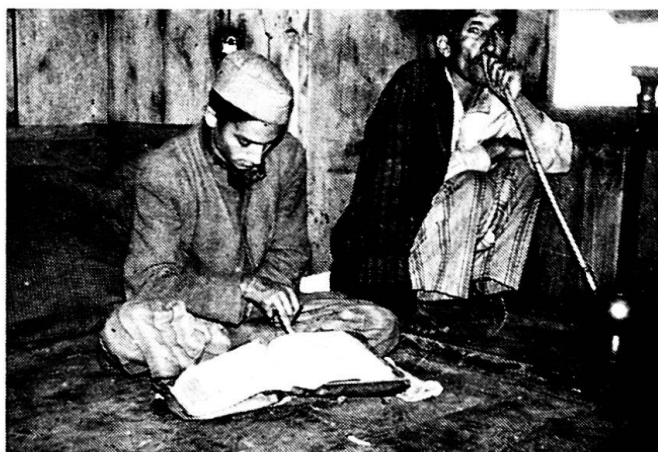
Abbildung 1. Priester mit krankem Rajput-Klienten

Die hinduistische Lehre von der Wiedergeburt, laut welcher der Mensch nach dem Tod seinen Verdiensten gemäß in einer hohen oder einer niederen Kaste