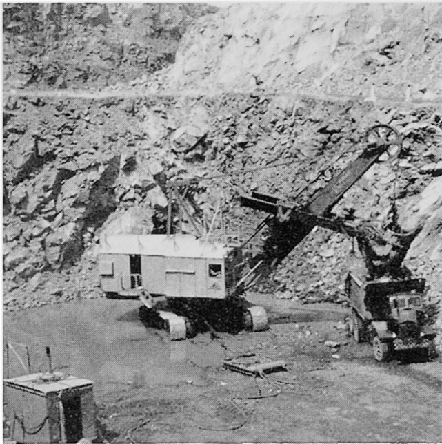
Bild 1 Erzabbau in der Clara Belle Mine