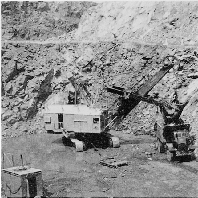
Bild 1 Erzabbau in der Clara Belle Mine