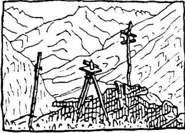
Meßtischstation Bignaroi, südwestlich von Biasca Aufnahmen 1:25000, Sommer 1936. Blick ins Ble- niotal

Permanente Ausstellung im privaten kartographischen Forschungsinstitut Thun. Alle Maßstäbe. Neuartige Mal- weisen. Die Skizzen sind verkäuflich; Offerten verlangen. Topokartographie, Geomorphographie, Zivilingenieurkar- tographie, Militärkartographie, Flug- wesen, Kartenwissenschaft, Karten- freunde, Wandschmuck