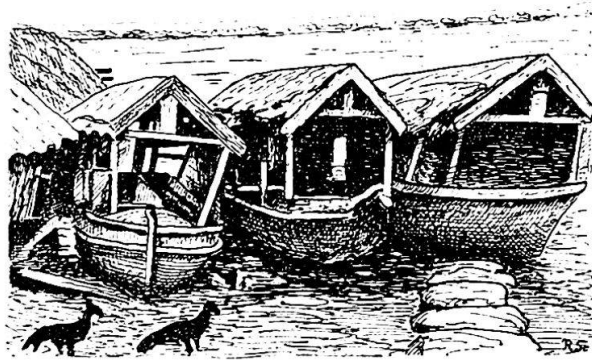
Canoas mit Hüttenaufbau (Batalaões)