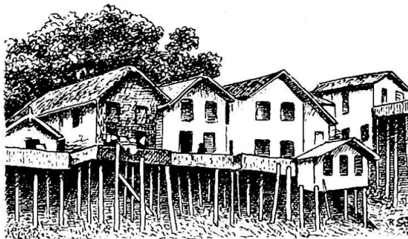
Pfahlbauten im Amazonasgebiet

«Chatas» (Die Flachen). Schließlich nennt man Schiffe, die als ambulante Verkaufsläden von Ort zu Ort gefahren werden «Regatoes» (Krämer). Mit der Verstaatlichung der Schifffahrt und wohl auch wegen dem Rückgang der Konjunktur geriet sie in Verfall. Die Bundesregierung mußte eingreifen. Seit 1955 versehen neue gute Dampfer den Dienst auf den Hauptströmen. In den Außenquartieren der Stadt, wo die Caboclos wohnen, sind verschiedene Schiffstypen im Gebrauch. Die einfache Canoa, genannt «Montaria», für 2 bis 3 Personen ist etwa 5 m lang, ausgehöhlt aus einem weichholzigen Baumstamm, zuweilen an den Seiten überhöht durch Bretter. Boote von 6 bis 8 m Länge heißen «Igarité» und haben hinten ein niederes Dach aus Rundstäben und Palmblättern. «Batalao» heißt das Schiff von 8 bis 10 m Länge, das auf der hintern Hälfte ein Miniaturhaus trägt. Diese Schiffe werden gewöhnlich nicht gerudert, sondern folgen angehängt den motorbetriebenen Chatas. Der Besitzer des Motorschiffes bezieht für den Schlepperdienst Bargeld oder Waren.