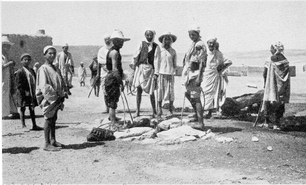
Brunnenreiniger an der Arbeit. Mit Seilen, Körben und Wassersäcken versehen, stehen sie um die Öffnung eines alten Brunnenschachtes.

höher gelegenen Gärten Einhalt zu gebieten. Es kam so in den Oasen des Oued Rhir in den letzten Jahrzehnten zu einem «Wandern» der Gärten von oben nach unten. Dennoch hat, im gesamten gesehen, die Wassermenge durch die neuen Bohrungen zugenommen und damit auch die Ausdehnung der Gärten. Heute zählt dieses Gebiet ungefähr 1 300 000 Palmen. Die Möglichkeiten zusätzlicher Wasserbeschaffung sind noch nicht erschöpft; nach Auskünften des Wasseramtes könnten allein dadurch, daß man die alten Brunnen ausbessern würde, noch weitere 100 000 Minutenliter gewonnen werden.