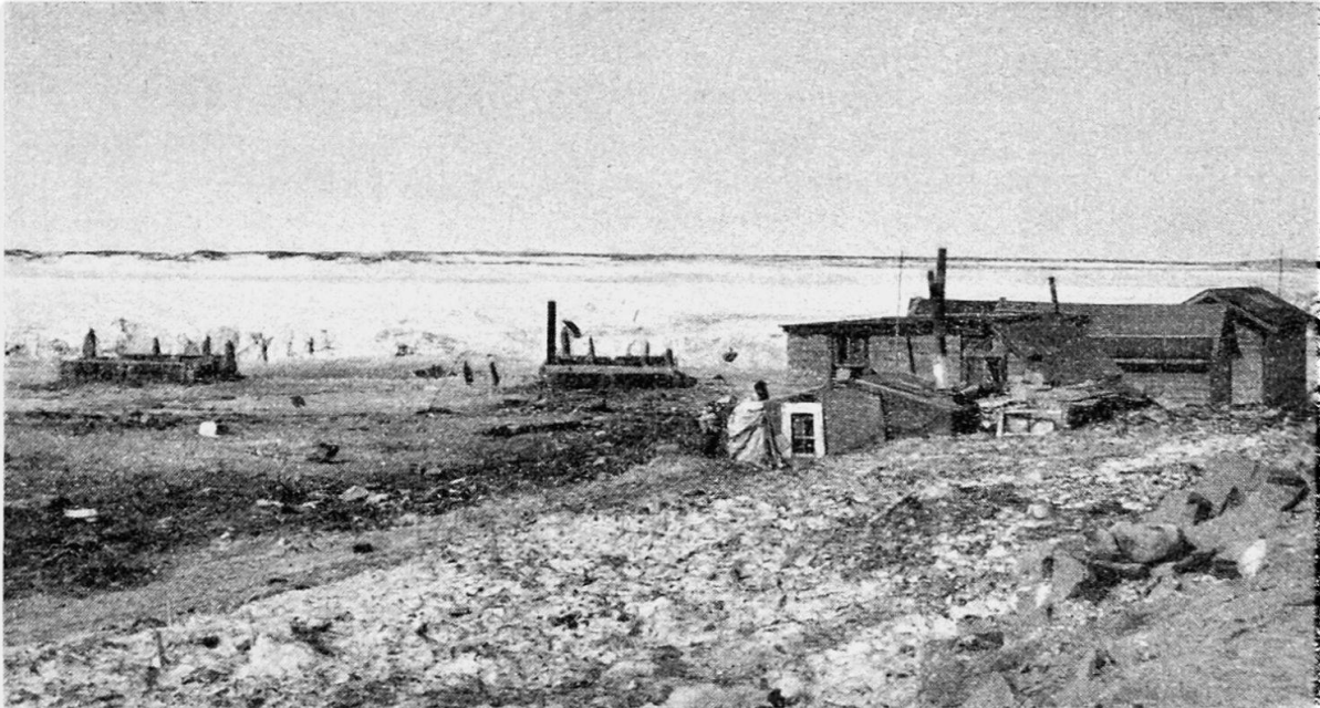
Hütten von Eingeborenen beim Hafen von Churchill. Links davon zwei Brettverschläge für die Schlittenhunde. Dahinter der zugefrorene Churchill River. Photo A. HUBER, 2. Mai 1951

Aus verständlichen Gründen stehen keine genauen Unterlagen über das heutige militärische Churchill zur Verfügung. Das Camp, 8 km landeinwärts vom Hafen gelegen, ist eine moderne städtische Siedlung mit allem Komfort, Spital, Schulen, Ein- und Mehrfamilienhäusern usw., die rund 5000 Personen, militärische Angestellte und ihre Familien, beherbergt. Sie ist Außenstehenden zwar verschlossen, doch arbeiten verschiedene Einwohner des zivilen Churchill dort, und die Bedürfnisse einer derart großen Siedlung bedeuten auch für das zivile Churchill, die Bahn, den Hafen, die Geschäftsleute, vermehrten Verdienst.