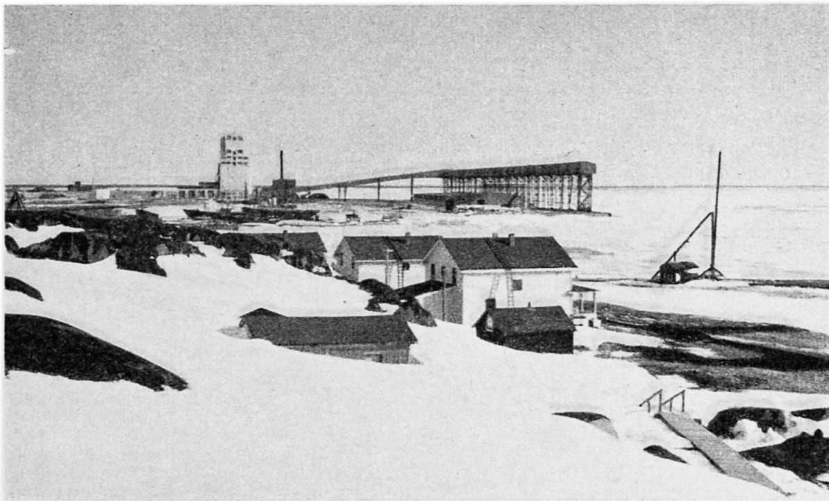
Blick auf den Hafen von Churchill, in Richtung SE. Links der Silo, rechts davon Mole und Anlagen für die Getreideverladung (Fließbänder und Röhren). Im Vordergrund Notspital, nur im Sommer geöffnet. Photo A. HUBER, 1. Mai 1951

leute und Hafenarbeiter, die vor allem von einigen großen Schiffahrtsgesellschaften in Montreal gestellt werden, und für drei Monate leben 1500 geschäftigte Menschen in der kleinen Ortschaft. Mit dem Weggang des letzten Schiffes Mitte Oktober verläßt der größere Teil von ihnen Churchill wieder, während ein Stock von rund 500 dauernden Einwohnern zurückbleibt. Zu ihnen gehören z. B. die Angestellten der Bahn und das Personal der Generatorenanlage und der Trinkwasserversorgung. Churchill bildet, was zentrale Dienste anbetrifft, trotz seiner Kleinheit eine sehr vollständige Einheit. Es besitzt neben den schon genannten Einrichtungen eine Bank, ein Postbüro, eine Radiostation, einen gut dotierten Polizeiposten, eine Schule, zwei Kirchen (katholisch und anglikanisch), eine katholische Mission, zwei Hotels, einen HBC-Posten, ein weiteres Kaufhaus, zwei Restaurants. Spital und Arzt stehen in dem etwa 6 km weit entfernten Militär-Camp zur Verfügung.