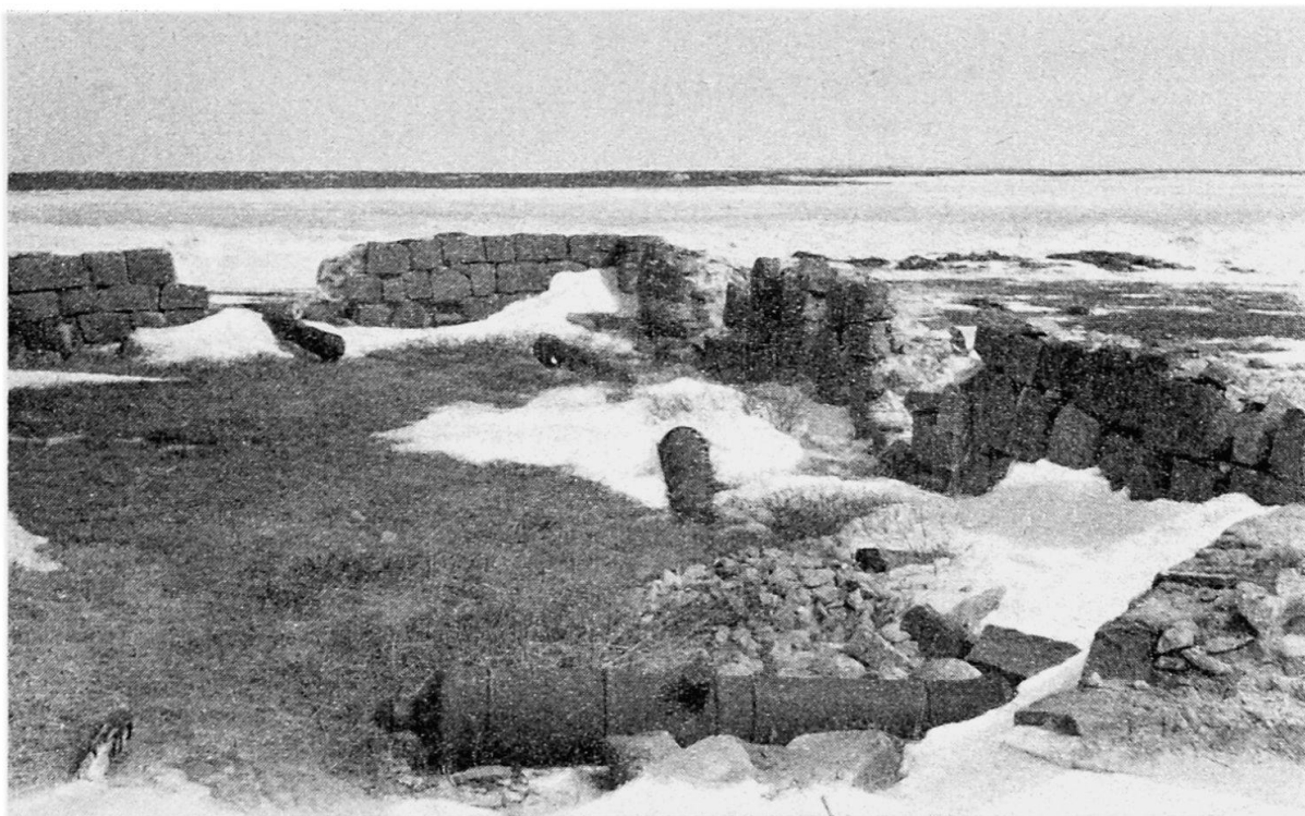
Fort Prince of Wales, Churchill. Bis auf einen kürzlich restaurierten Teil blieb die Ruine so erhalten: wie sie die Zerstörer 1782 zurückgelassen hatten. Hinten W-Ufer der Hudson Bay.