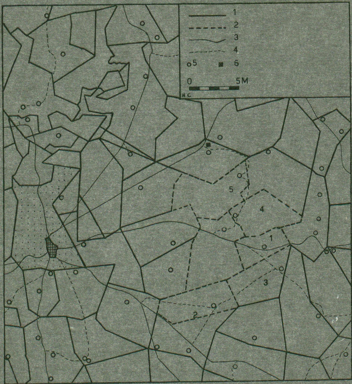
Fig. 12 Betriebliche Struktur der Agrarlandschaft von Beaufort West. 1 = Farmgrenzen nach älterer Grundbuchkarte, 2 = heutige Grenzen von untersuchten Farmen, 3 = Straßen, 4 = Fahrwege, 5 = Farmgebäude (nach topogr. Karte 1:250 000), 6 = Allesladen.