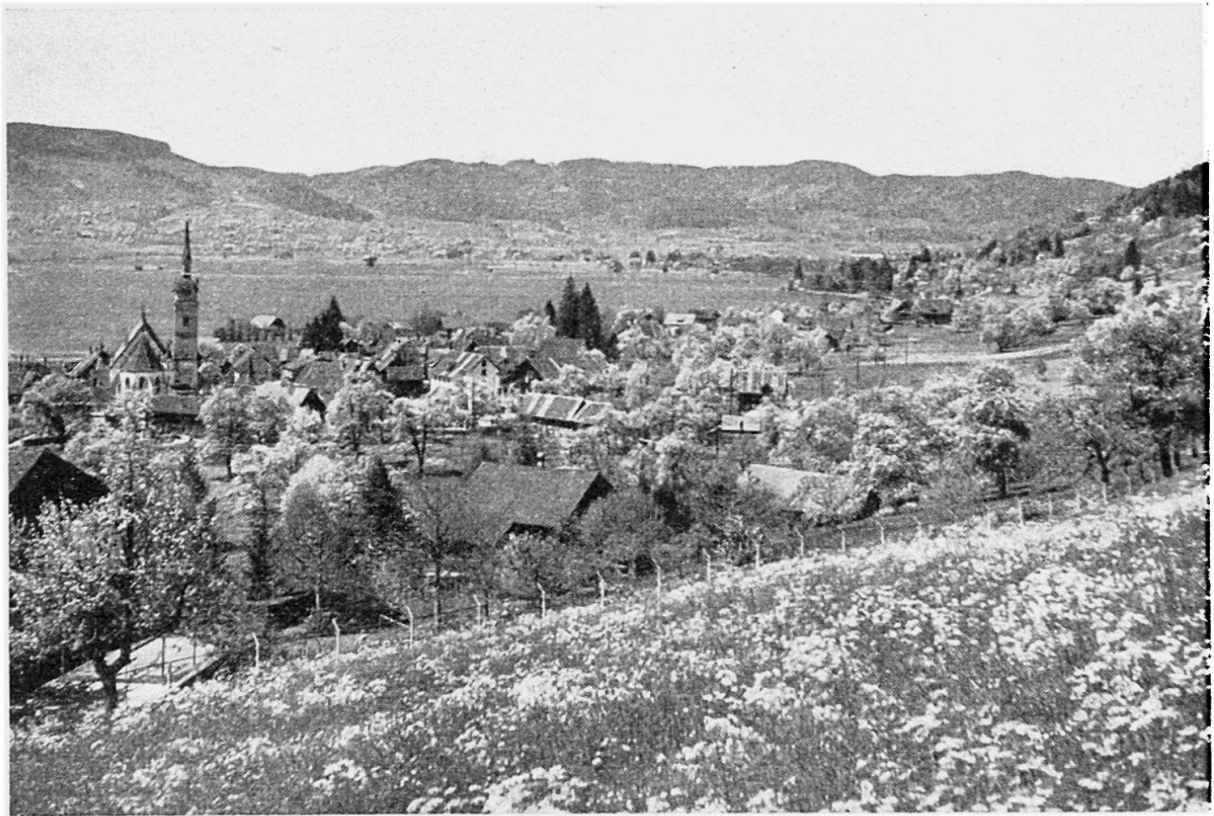
Abb. 1 Hochtal von Ägeri , Blick über Oberägeri und den Ägerisee auf den Zugerberg (Hintergrund)

und Ton in diese grobe Situation einfügen. Die Schulpraxis zeigte, daß eine solche Karte zur Einführung in das Verständnis der Landschaft, zum Kartenlesen, sich schlecht eignet, und Kartenleseübungen auch mit größeren Schülern mit ihr ergaben klägliche Resultate. Die Kartenkommission zur Erstellung einer neuen Schülerkarte verweilte daher nicht lange bei der Frage, ob für die Unterstufe eine primitivere Darstellung als für die oberen Klassen und den Touristen zu wählen sei. Immerhin entstand eine interessante Diskussion über dieses Thema, ein Thema, das auch andernorts bei der Neuschaffung von Schülerkarten aufgerollt zu werden verdient.