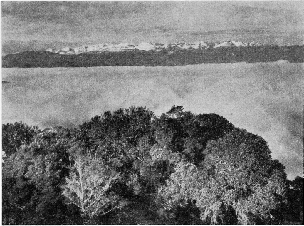
Abb. 3. Tropischer Höhen- und Nebelwald am Ostabfall der bolivianischen Hochkordillere, Provinz Inquisivi. Im Hintergrund Cordillera Quimzacruz. Hochgebirgswaldlandschaft an der Waldobergrenze (3600 m) als Beispiel des Unterschieds zwischen Wald als Landschaft und bloßen Gehölzformationen. Aus Bericht über das Geobotanische Forschungsinstitut Rübel, für das Jahr 1947. Zürich 1948.