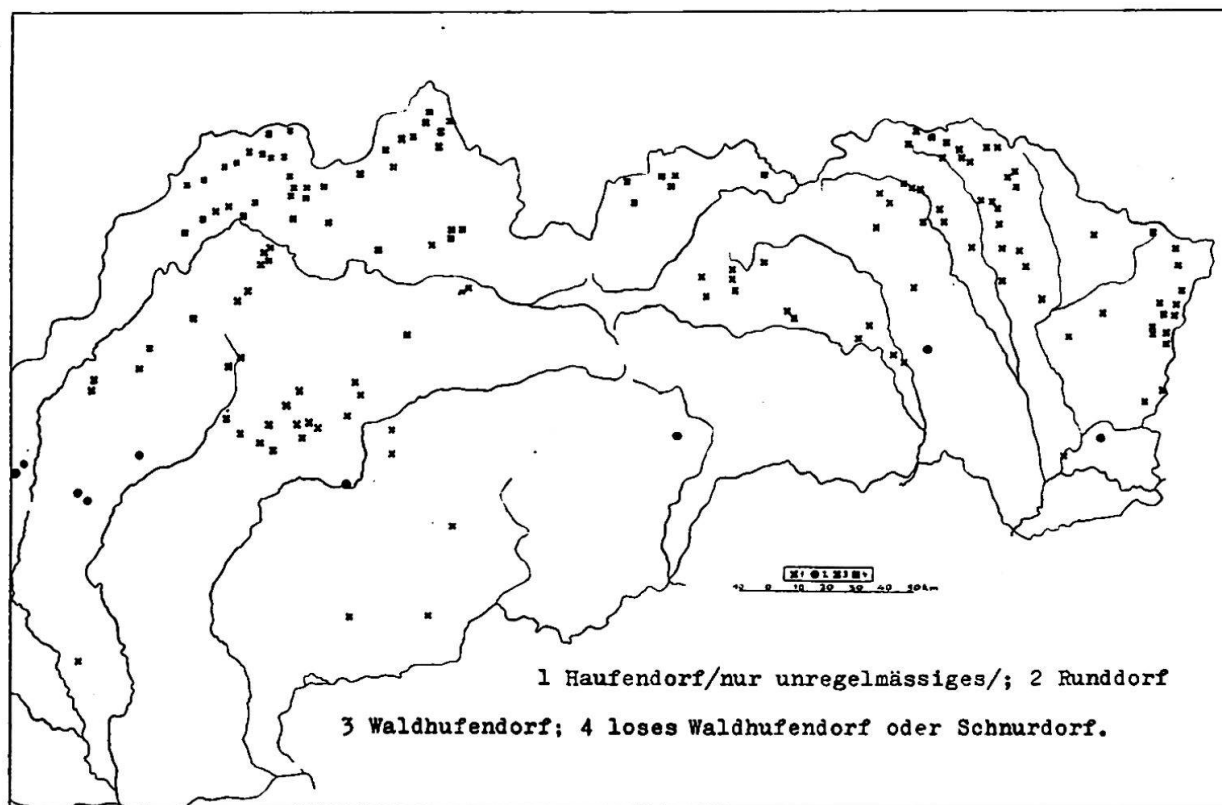
Karte 2: Einige Typen slowakischer Siedlungsformen

Im Einklang mit der genetischen Methode war es jedoch nötig, einige Korrekturen durchzuführen, damit die Karte gewisse Tatsachen nicht entstelle, die durch die Entwicklung bedingt sind. Diese Korrekturen hält die Karte 2 fest, auf der nur die unregelmäßigen Haufendörfer eingezeichnet sind. Nur diese werden nämlich genetisch als echte Haufendörfer angesehen. Der Vergleich der Karte 1 mit 2 zeigt sodann,