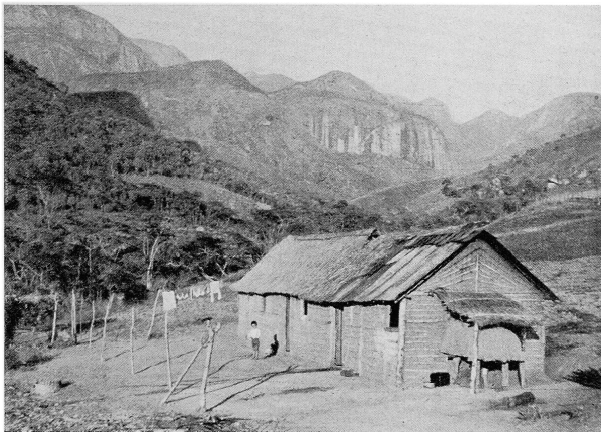
Fig. 2. Une haute vallée dans la « Serra dos Orgaos » bord du Plateau Brésilien, au Nord de Rio de Janeiro.