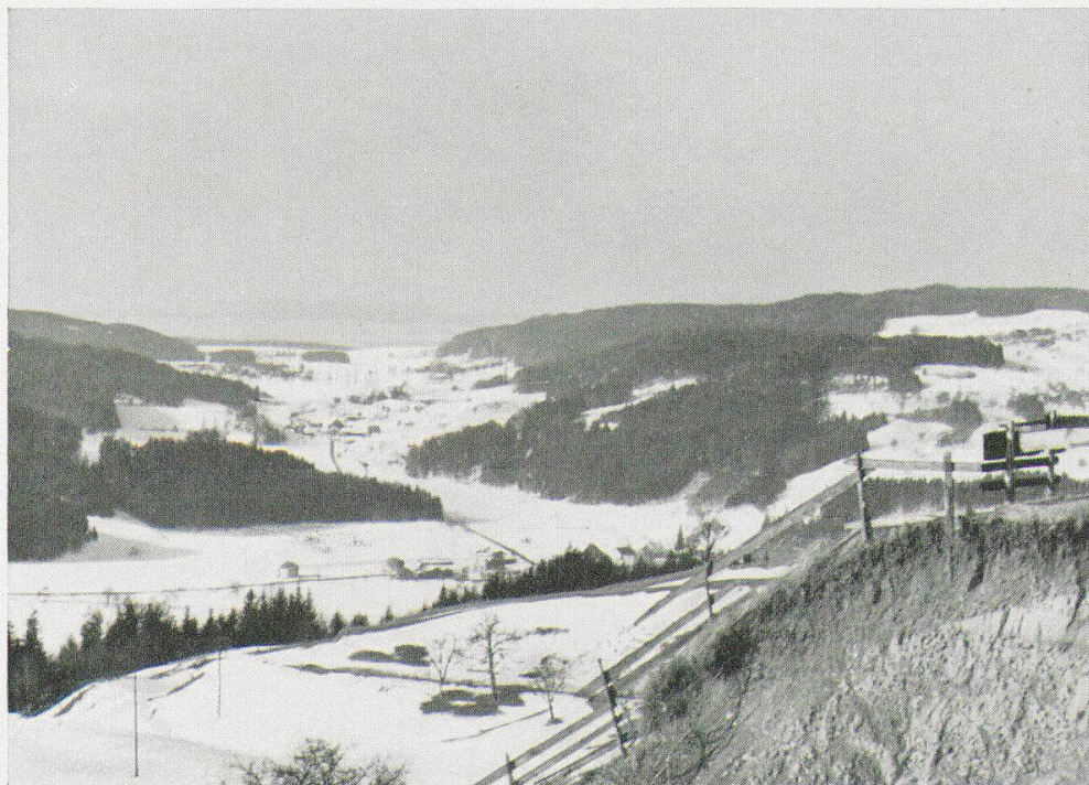
Abb. 2. Blick von Vorder-Eich (768 m ü. M.) ob Saland ins Trockenquertal von Hittnau. Rechts: Tannenberg (821 m ü. M.), links: Zimmberg (742 m ü. M.). In der Mulde liegen die Weiler Laubberg, Hasel, Schönnau. Die Muldenpartie im Hintergrund (Unter-Hittnau) entwässert sich zum Pfäffiker See. Von dort drang zur Eiszeit ein Gletscherlappen ein. Schmelzwässer durchzogen den untern Teil der Mulde, in Richtung zur Töb. - „Biswind-Kanal!“