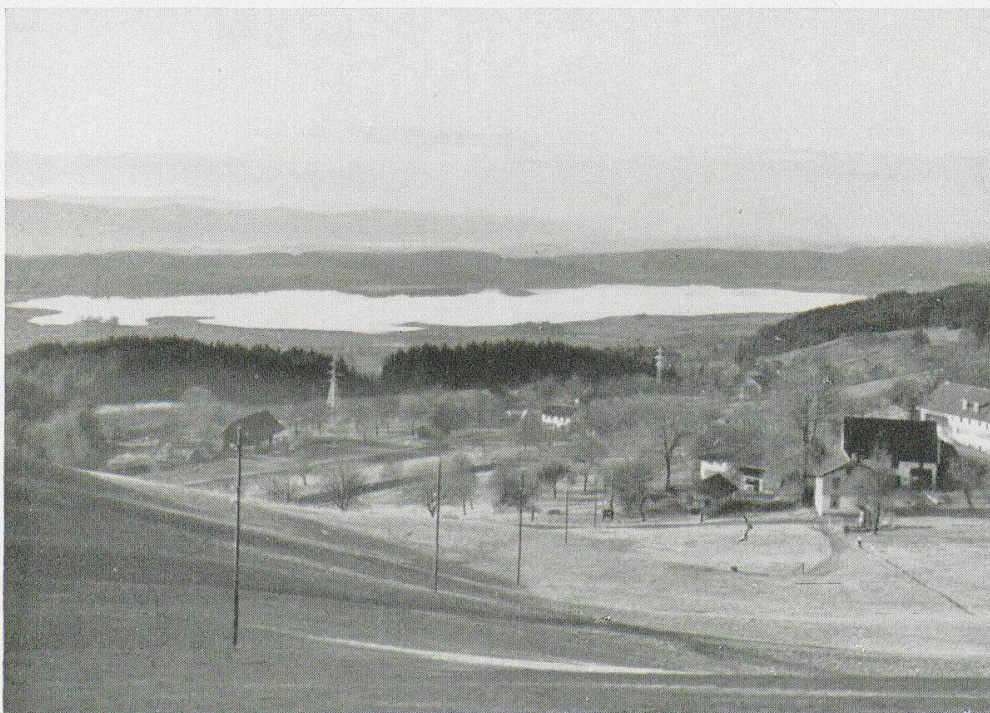
Abb. 1. Blick vom Rosinli (823 m ü. M.) über den stark besonnten SW-Hang auf das Pfäffiker-See-Becken und ins mittlere Glattal. Mittelgrund: Waldreste an steilern Hängen und Obstbaumbestände auf den Ebenheiten. Dasselbst die Streusiedlung Egglen (Mitte) und (vorn rechts) der geschlossene Weiler Waberg. Das zunächst gelegene Haus ist ein Handsticker-Haus (ohne Umschwung, Parterre mit ehemaligem Maschinenlokal). - Skigelände. Morgenaufnahme, März 1943.