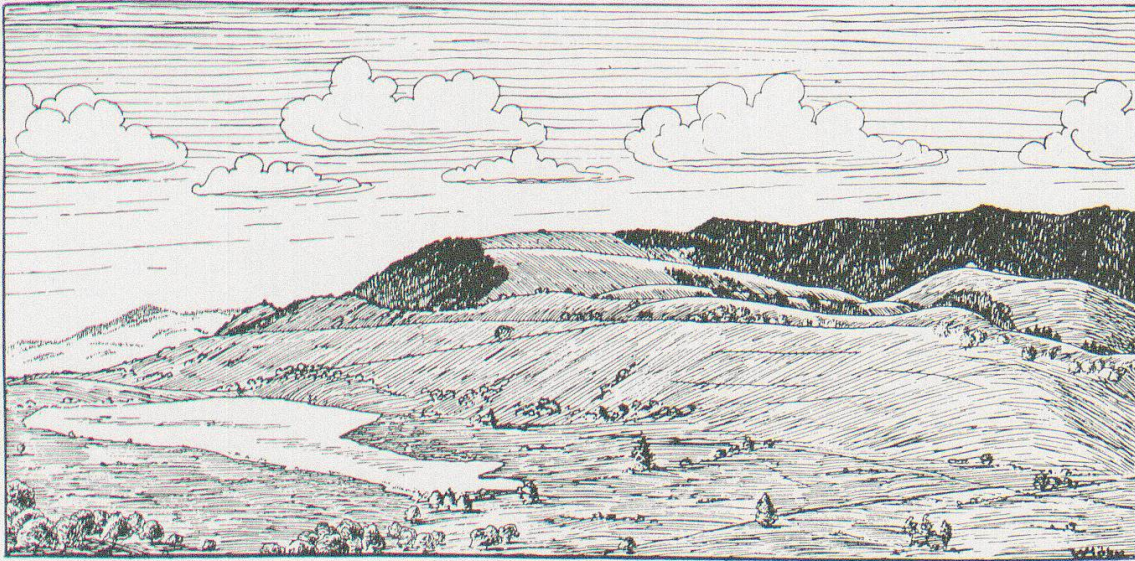
Abb. 1. Blick von der Laubegg auf Hüttner See und Hohen Ron.