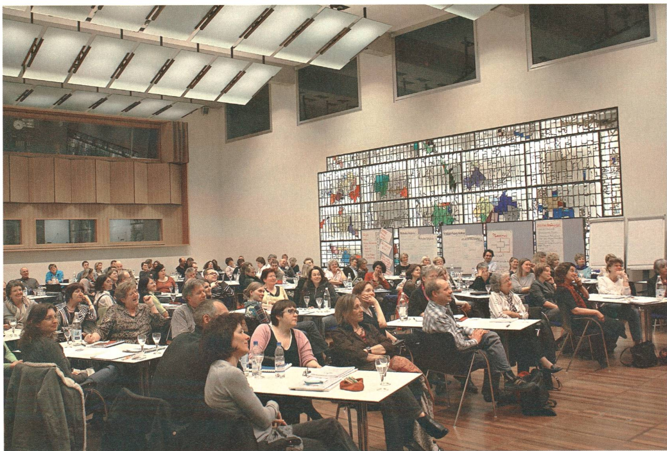
Oben das Kollegium der Verkaufsschule im März 1987, unten das Kollegium der BFS Basel während einer Weiterbildung im April 2009. Die Veranstaltung fand im Ausbildungszentrum der UBS an der Viaduktstrasse statt, Thema war «Kooperatives Lernen».