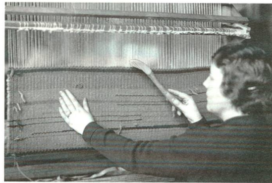
Hutmachen, Nähen, Weben – in Kursen werden verschiedene Handarbeiten unterrichtet.