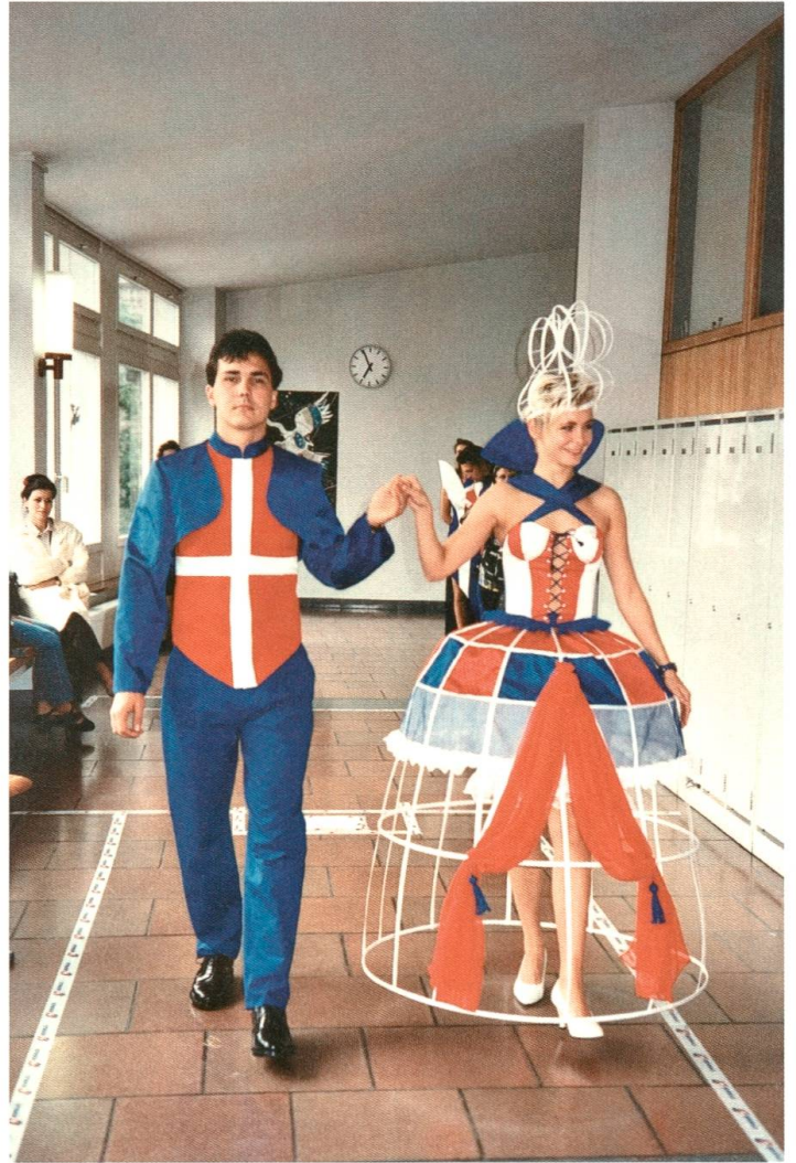
1997 schrieb die Crossair einen Modewettbewerb aus. Motiv und Farben mussten mit der Firma zu tun haben, zu gewinnen gab es Flugtickets. Hier wird in den Gängen vor den Couture-Ateliers der BFS geprobt; die Modeschau fand im Firmensitz der Crossair statt.