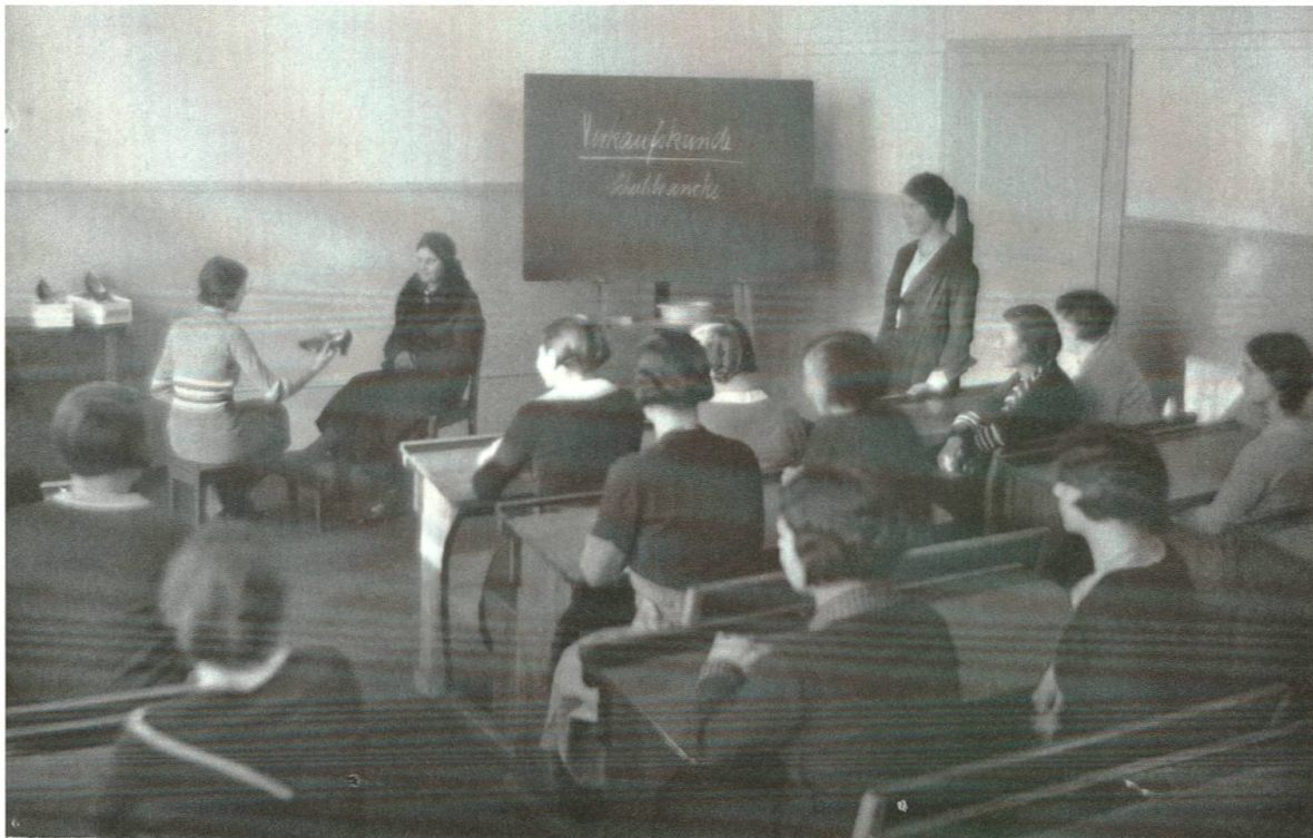
Verkaufskunde der Textilbranche und der Schuhbranche an der FAS.