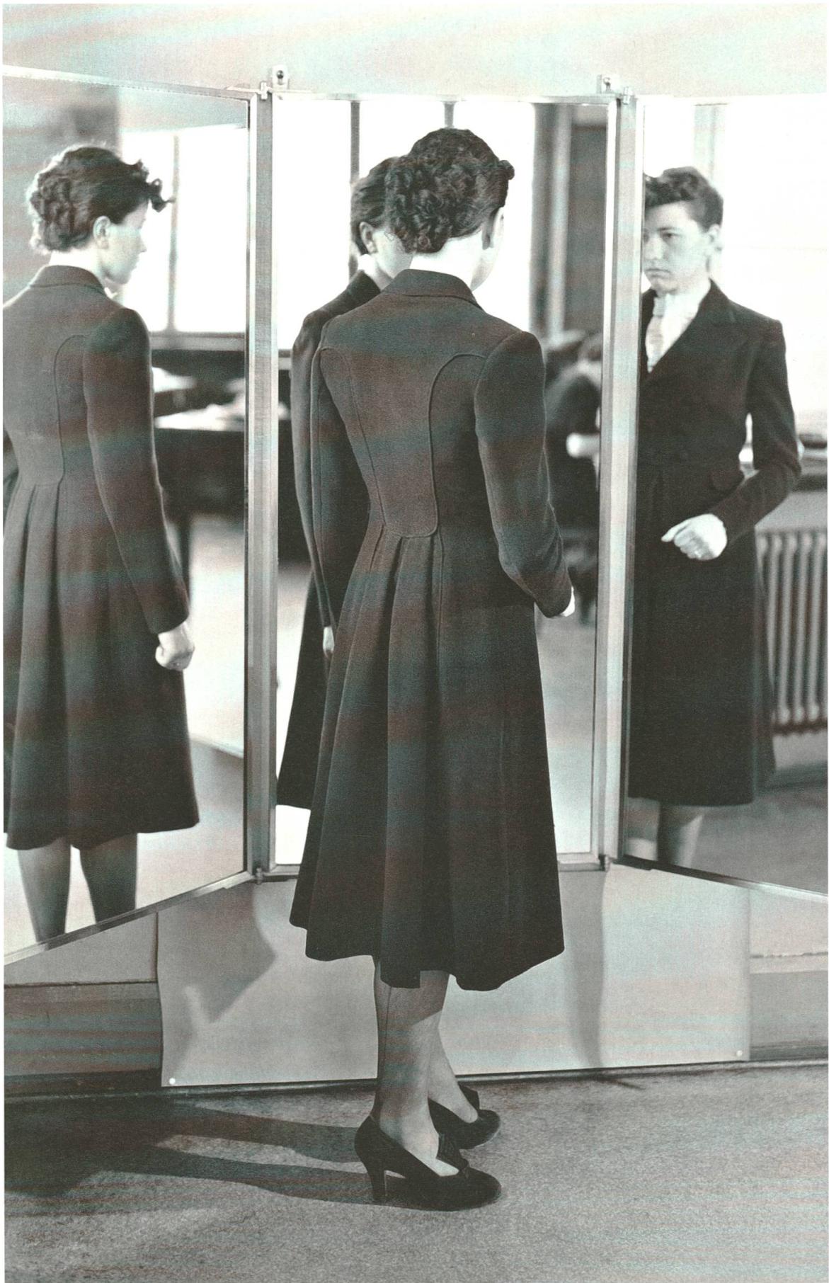
Anprobe im Bekleidungsatelier.