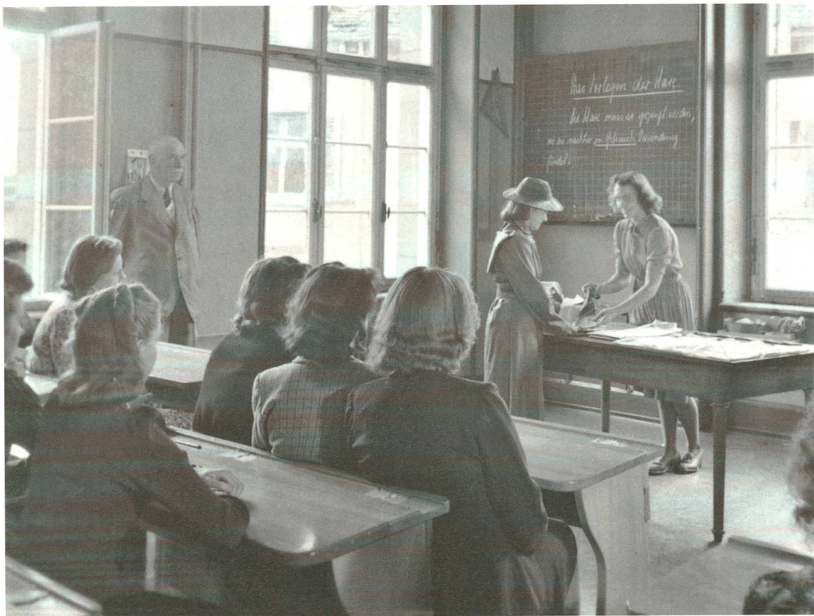
Verkaufskunde Chemiserie. An der Tafel steht: «Das Vorlegen der Ware. Die Ware muss so gezeigt werden, wie sie nachher im Gebrauch Verwendung findet.» Im Hintergrund sieht man Kommissionsmitglieder oder Prüfungsexperten, die das Verkaufsgespräch beobachten.