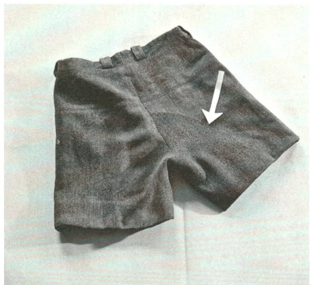
Vorher zerrissen – nachher geflickt. Anschauungsmaterial, vermutlich aus dem Fach Knabenkleider.