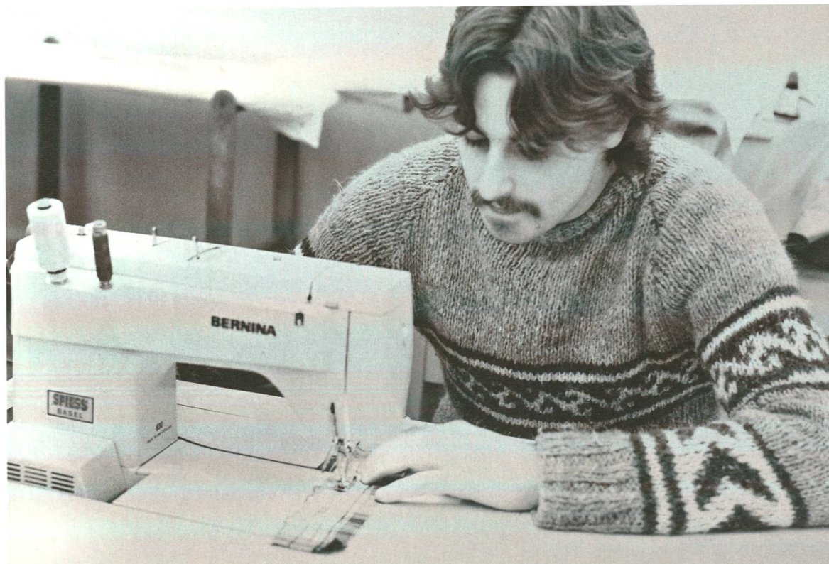
Maschinennähen im Laufe der Jahre – Arbeitsinstrumente verändern sich, und Geschlechterrollen werden vom Zeitgeist beeinflusst.