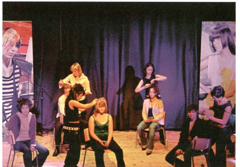
Frisieren als Übung im Kurs und vor Publikum. Coiffeusen werden seit 1916 an der Schule unterrichtet.