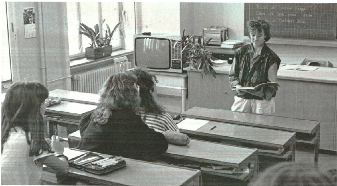
Hellraumprojektor und Fernseher – der Gebrauch neuer technischer Hilfsmittel im Unterricht, hier im Hörsaal, Gebäude A, wurde fotografisch festgehalten.