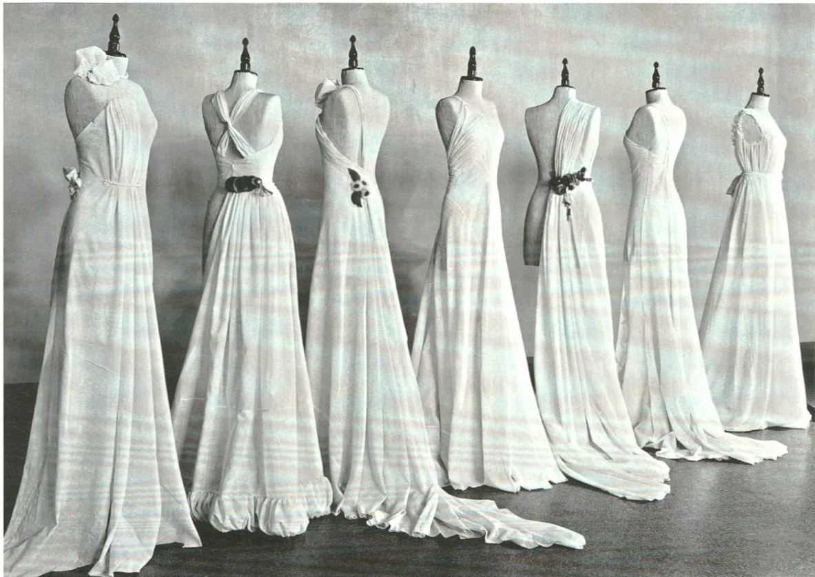
Fachbereich Kleider Abformen. Die Aufnahmen stammen wahrscheinlich aus einem Vorbereitungskurs für die Meisterprüfung Damenschneiderei.