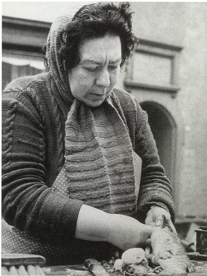
Abb. 3 Fischverkäuferin am Rümelinsplatz, 1954.

In der zweiten Hälfte des 16. Jahrhunderts vergütete das Almosenamts zur Speisung der Armen die Kosten für Linsen- und anderes Mus, für Butter, Zwiebeln und Salz. Dazu waren jährlich neun Fleischmahlzeiten vorgesehen, Fische sind nicht erwähnt. 39 Minderbemittelte mochten sich an die «Schelmenbank» auf dem Fischmarkt halten, wo verendete Fische, die nicht mehr als «grüne» (lebende) Ware verkauft werden durften, zu haben waren, oder sie kamen als «arme siechen im spittel» zu Fischgenüssen. Dank einer Stiftung erhielten die Kranken während der Fastenzeit dreimal wöchentlich «zuo imbiss visch gross oder klein wie man die ye zuo zyten gehaben mag und die in ein gewurzt bruelin machen» sowie am Karfreitag eine Portion «Fisch-Galrey». Die Spitalrechnungen von 1521 und 1534 führen eine reiche Fischtabelle an Lachsen und Salmen, Karpfen, Forellen und Albelen ( Leuciscus alburnus ) auf. Des Weiteren sind Heringe und Nasen ( Chondostroma nasus L.) verzeichnet. 40 Die anspruchslosen und bis in unsere Gegenwart beliebten Nasen wurden während der