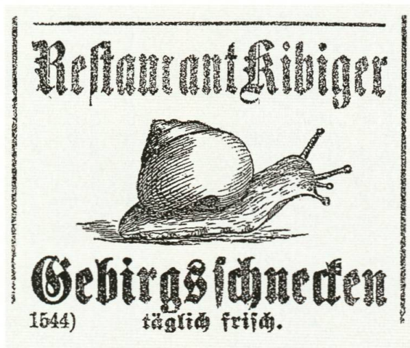
Abb. 4 Schneckenkuren in der vorösterlichen Fastenzeit. Inserat im «Schweizerischen Volksfreund» vom 27. Januar 1883.

Verwöhnte Gaumen delectierten sich schon im Altertum an Weinbergschnecken und Fröschen. Die mittelalterliche Kirche setzte diese Tiere als «Kaltblütler» den Fischen gleich und erklärte sie als fastentauglich. Man schätzte das wohlschmeckende, leicht verdauliche Fleisch als Leckerei und bediente sich dessen in Festbrauch und Liebeszauber, wie auch in der Tier- und Volksheilkunde. 45 Durch das Aufkommen von Zeitungsinserten wurden diese extravaganten Fastenspeisen zu Konsumartikeln der